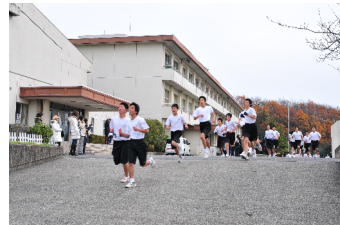
誰もが真剣に走る、マラソン大会