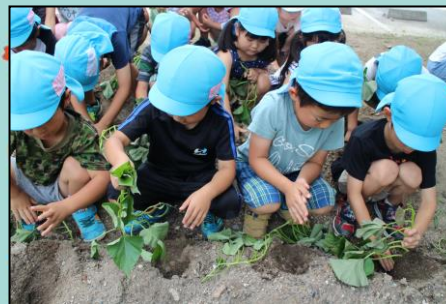
食育 野菜の苗を植えました