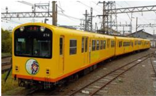
K74編成(現在楚原れんげラッピング)