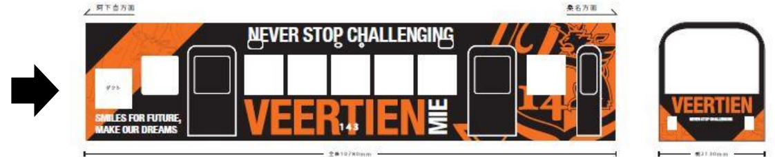
外装ラッピングイメージ 案