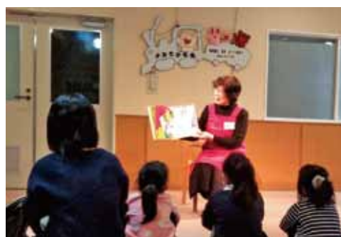
▲図書館での読み聞かせ