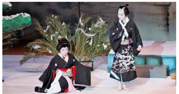
弁天娘女白浪 浜松屋の場