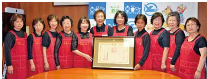
▲受章された皆さん