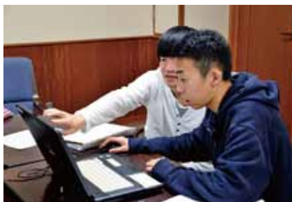
▲できあがったスライドショーをチェック

前日は本番に向けてリハーサルが行われ、当日の動きを何度も確認していました。リハーサルでは緊張していたメンバーも、当日最後のあいさつでは笑顔で今までの感謝の思いを晴れやかに語っていました。