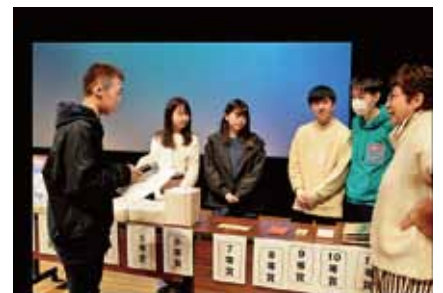
▲本番に備えて入念にリハーサル