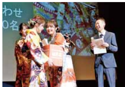
▲抽選会は大盛り上がり！