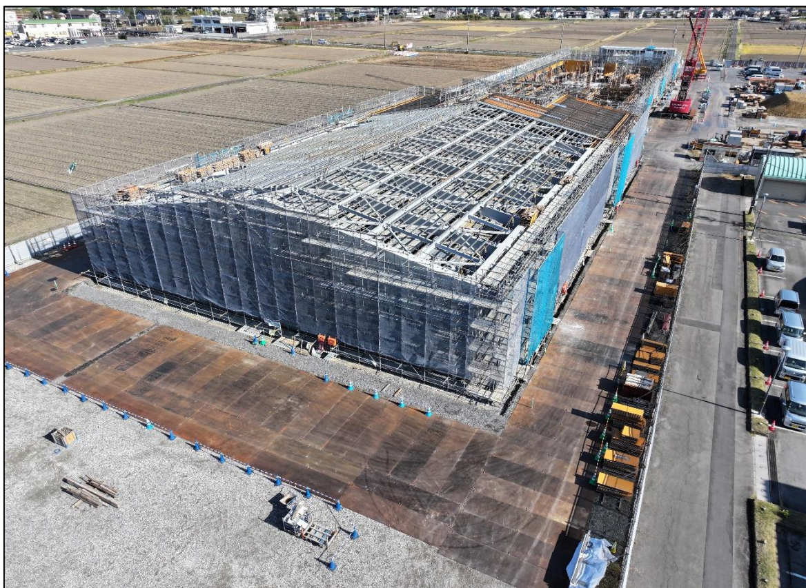
【敷地西側：体育館棟】 骨組み+コンクリートの施工も進んでいます。