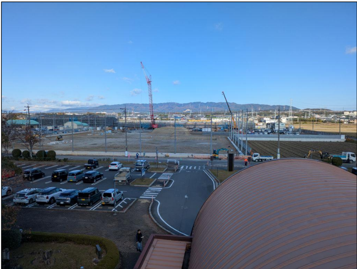
【敷地内】 総合文化センター屋上から