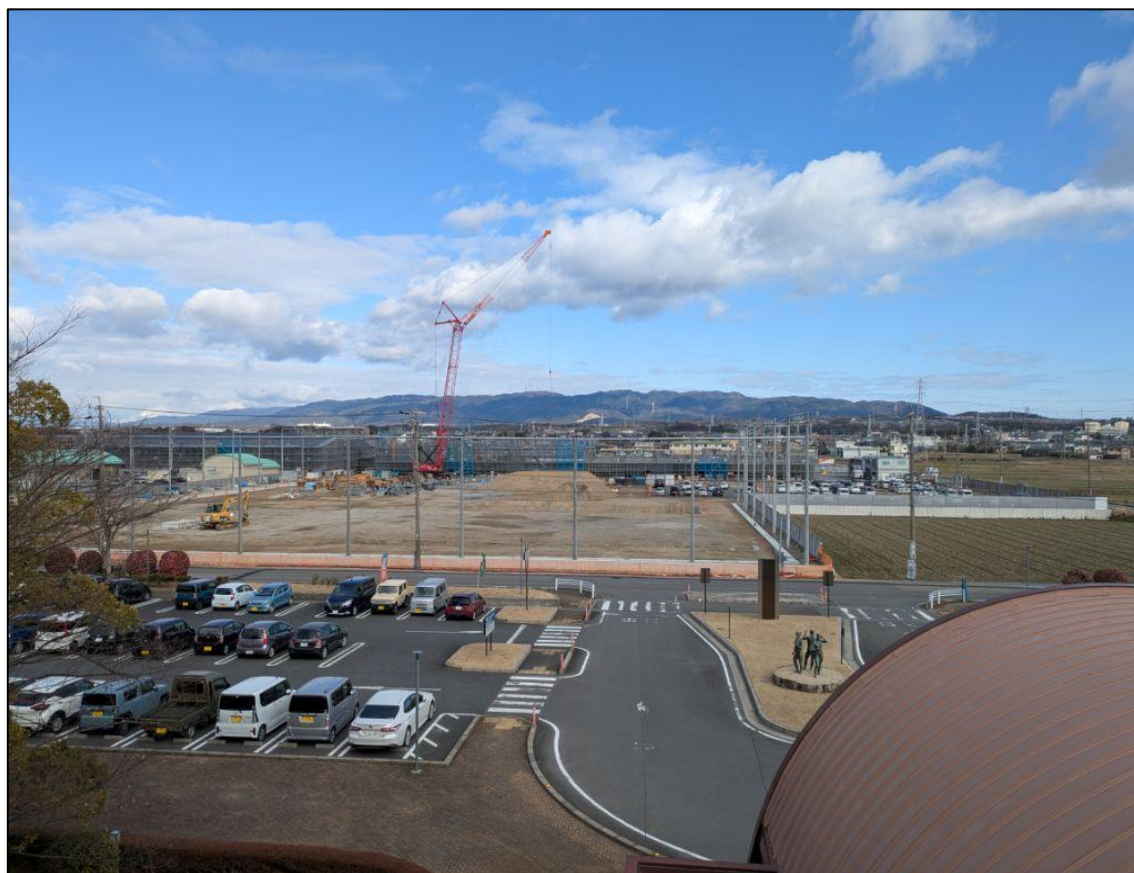
【敷地内】 総合文化センター屋上から