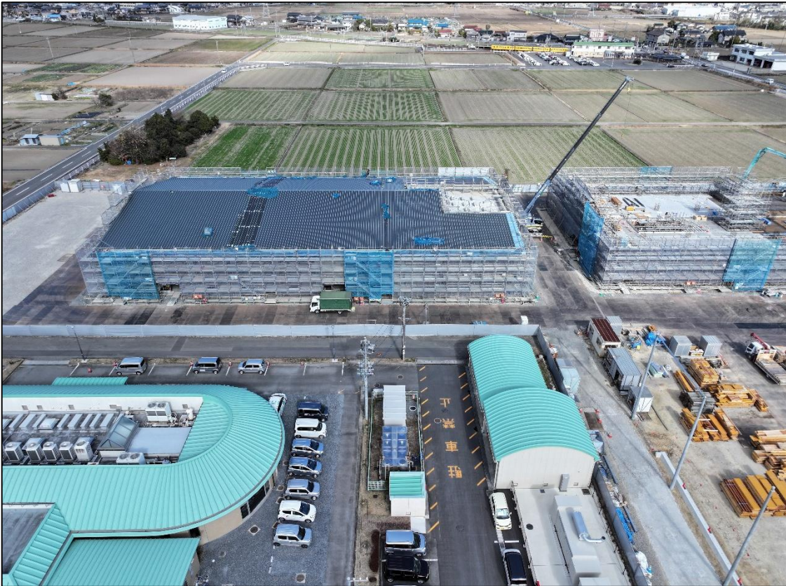
【敷地西側：体育館棟】 屋根はほぼ完成しています。