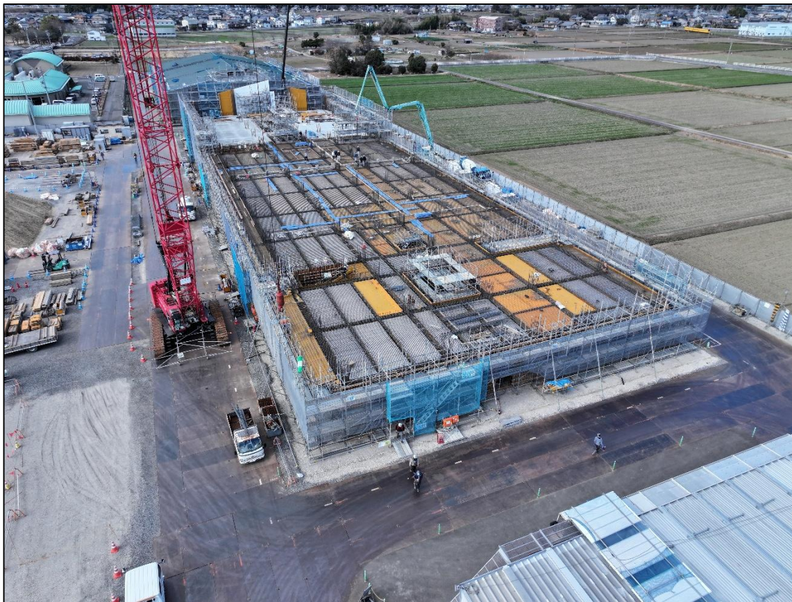
【敷地東側：校舎棟】 2階部分のコンクリートを打設しています。