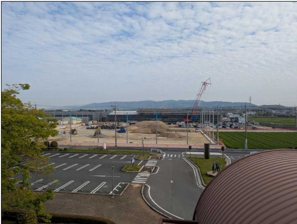
【敷地内】 総合文化センター屋上から