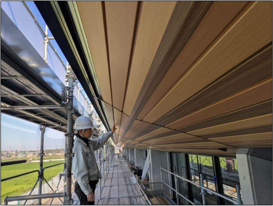
【体育館棟 軒天部分】