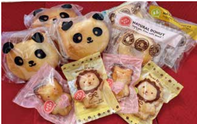
ご飯 パン ダよ（後列左）、米粉焼きドーナッツ（後列右）、こめこあにまるやきどーナっつ（前列）