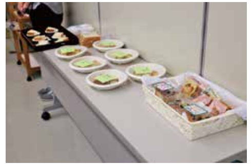
令和3年度東員町特産品認定審査会の様子