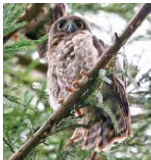
猪名部神社に飛来するアオバズク