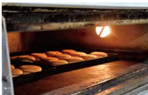
シフォンケーキ出来上がり間近です