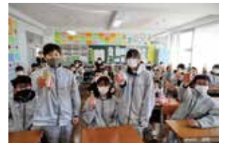
猪名部ジンジャーエールをプレゼントされた生徒