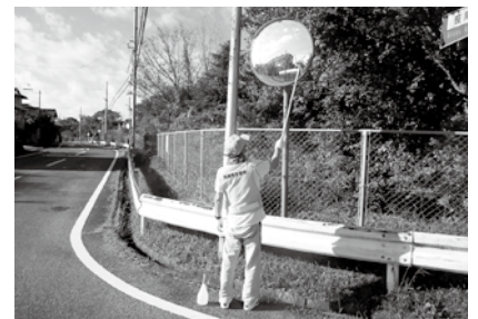
▲カーブミラー点検・清掃の様子

問 建設課 土木係 ☎86-2809 Eメール kensetu@town.toin.lg.jp