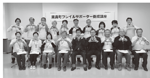
▲フレイルサポーター1期生の皆さん