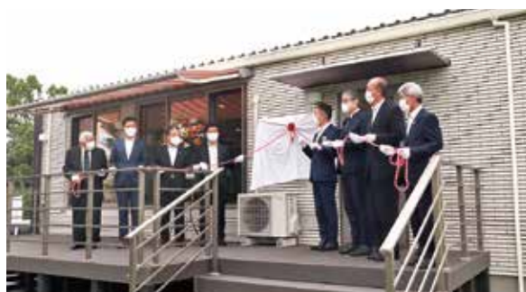
▲9月17日に行われたマメマチCAFE除幕式の様子