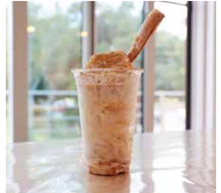
煎りたて黒きなこ氷