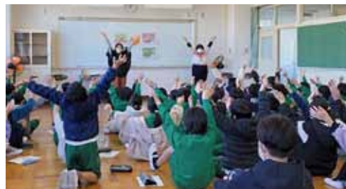
▲令和3年度子どもの権利ワークショップの様子

皆さんもこの機会に「子どもの権利」について考えてみませんか？地域の皆さんや保護者に向けた「東員町子どもの権利条例概要版(大人用)」を町ホームページに掲載していますので、ぜひご覧ください。