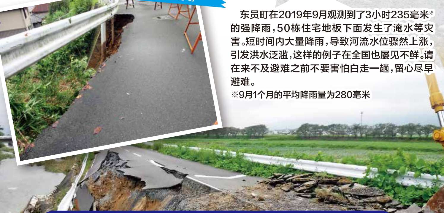
2019年 大雨造成的悬崖坍塌

东员町在2019年9月观测到了3小时235毫米*的强降雨,50栋住宅地板下面发生了淹水等灾害。短时间内大量降雨,导致河流水位骤然上涨,引发洪水泛滥,这样的例子在全国也屡见不鲜,请在来不及避难之前不要害怕白走一趟,留心尽早避难。 *9月1个月的平均降雨量为280毫米