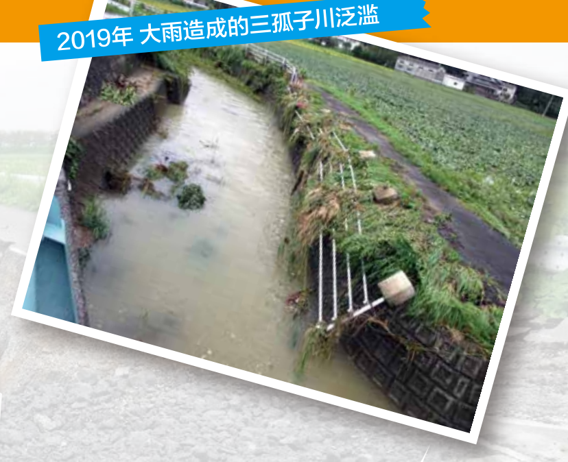
2019年 大雨造成的三孤子川泛滥

近年来,频繁发生急剧的大雨、台风及地震等。不要“因为至今没有发生灾害”而放心,请使用本风险地图采取灾害对策,尽可能地减少灾害损失。