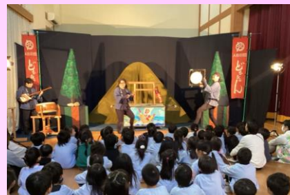
人形劇観劇 楽しいお話に夢中です