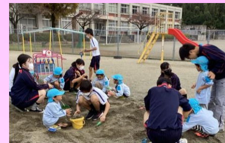
東員第二中学校との交流 一緒に砂場遊びをしました