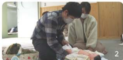
1助産師が沐浴指導する様子 2おむつ交換の練習