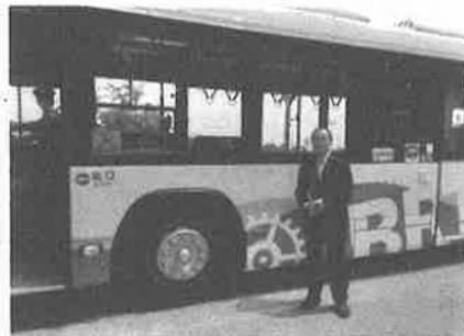
日立市新交通システムBRT前にて

特に危険度A・Bをしっかりと注視していきたいと思っております。お気づきの危険な空き家がありましたらご一報ください。