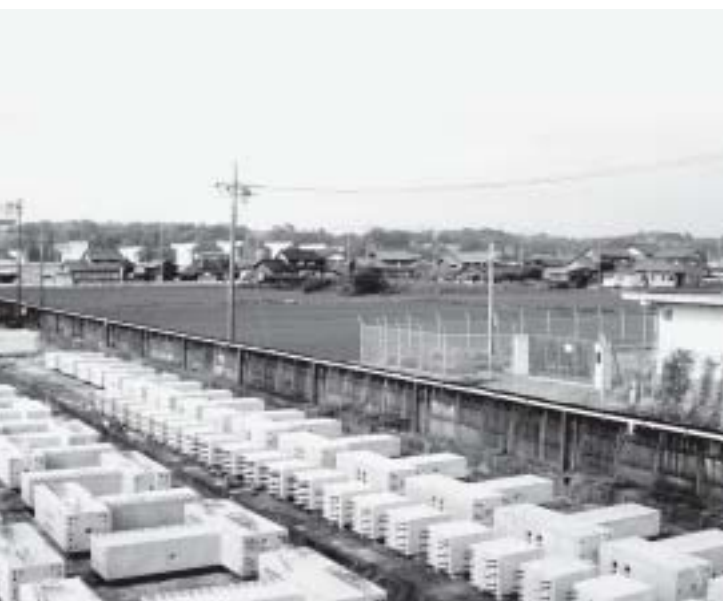
下水道区域の見直しを

教育長 国内外の状況および、厚生労働省・WHO（世界保健機関）などの情報を注視し、8月までに再度協議して結論を出します。