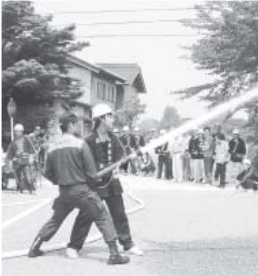
みんなで協力しましょう

*E*A(エンタープライズアーキテクチャ)とは組織全体を通じた業務・システムの最も適切な計画を立て、図表などによって表す手法のこと。