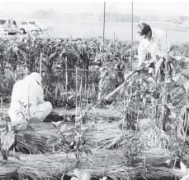
収穫が楽しみです

既存の農業者が中心の経営強化を望みますが、遊休農地解消への企業参入は一考すべきものがあると思われれます。