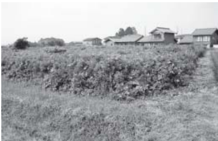
せっかくの農地 有効利用を

町長 町内には耕作していない農地が14haあります。地目別では、田が3ha、畑が11haで、農地面積の18%に当たります。農業を取り巻く構造的な環境の変化の中で、担い手不足、高齢化が顕著に進んでいることや、水利の問題なども原因であるのではないかと思われまます。また地権者に農地流動化への理解が得られないこともあります。