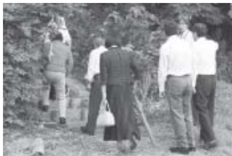
委員会で現地調査

答 5月の平日と休日に調査をしました。利用者は推計900人で、そのうち約半数は墓参の方でした。アンケート調査はしていません。