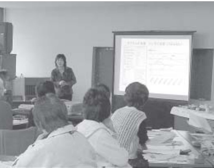
健康教室を開催しています

健康に対する保健師の指導をしています。国・県からの助成が受けられるよう働き掛けます。