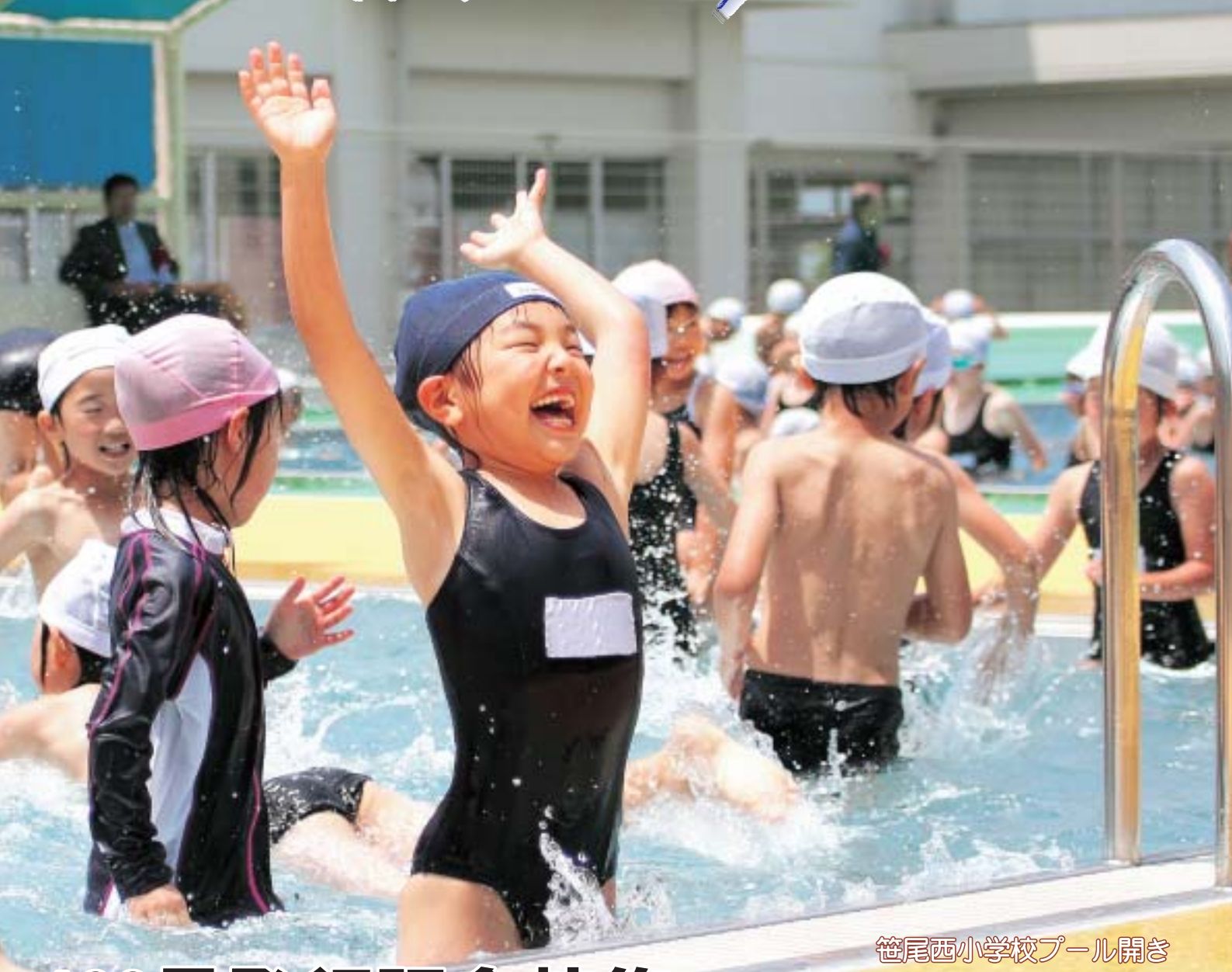
笹尾西小学校プール開き