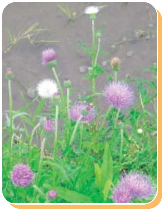
白いアイザミを見つけました

太陽もプールの完成を祝ってくれているよ うな梅雨の晴れ間。全児童は新しくなったプー ルで、元気いっぱいにはしゃいでいました。