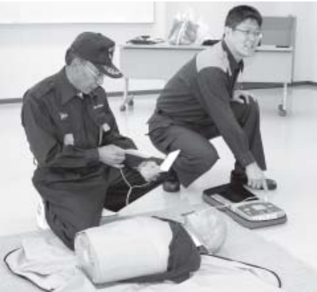
いざというときのために