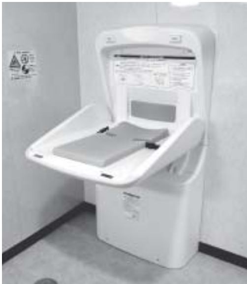
安心してオムツ換え

発電パネルを設置するには、さらなる耐震基準を満たす必要があるため、現在は考えていません。パソコンなどは情報機器を活用した教育に必要なため、経済対策の計画に計上しています。