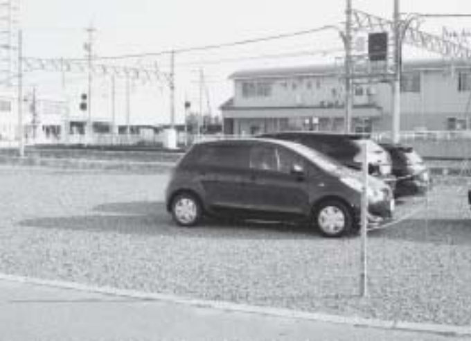
東員駅北側に駐車場