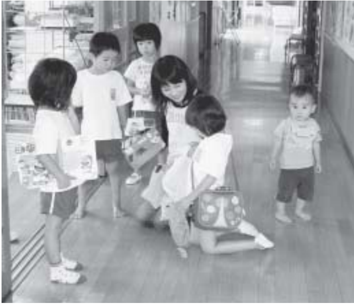
楽しく1日遊べました