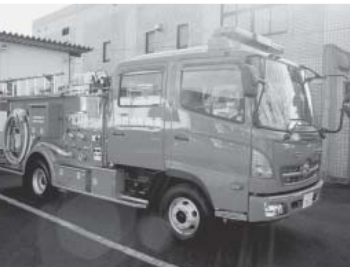
強力な防災の助っ人