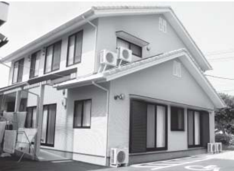
グループホーム「つくしの家」第2

金を支出していきます。障害者自立支援法は改善されてきましたが、今後も動向を見極めながら支援を続けていきます。 *ほかに今後のごみ行政、臨時教諭・保育士の日給について質問しました。