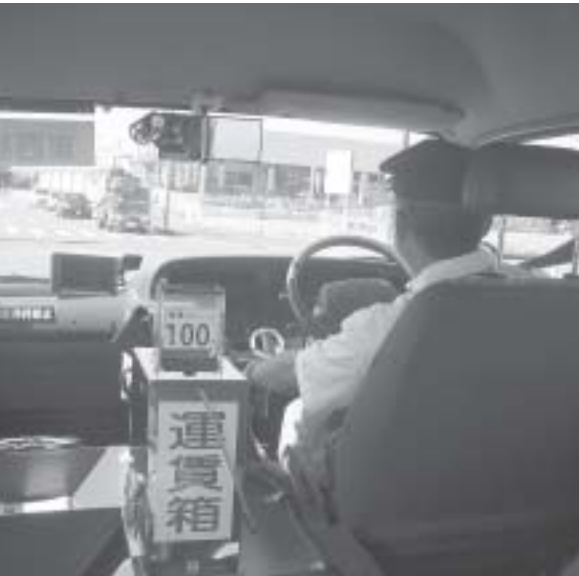
どこまで行っても100円

町長 業務委託契約・業者選定はプロポーザル方式を採用しました。安全性の確保や管理体制などを考慮し、路線ごとに見積り、八風バスと三岐鉄道、三重交通の3社を選定しました。