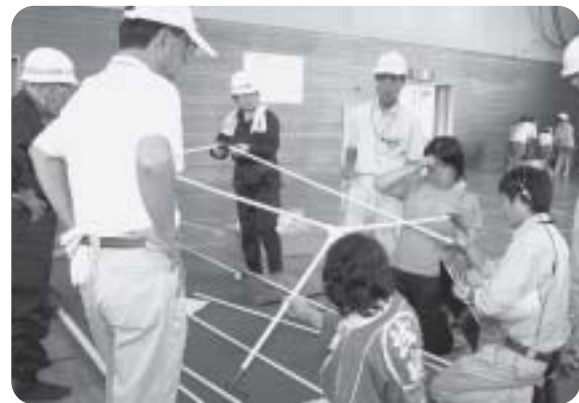
簡易トイレの組み立て

議会も訓練に参加し、大変であることを体験しました。 災害が起きたときにこの訓練の成果が発揮できるようにしたいものです。