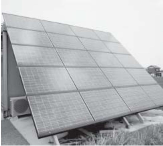
最近よく見かけますね

※ほかに笹尾地区の空き地・空き家の雑草、ごみ対策とCATVについて質問しました。