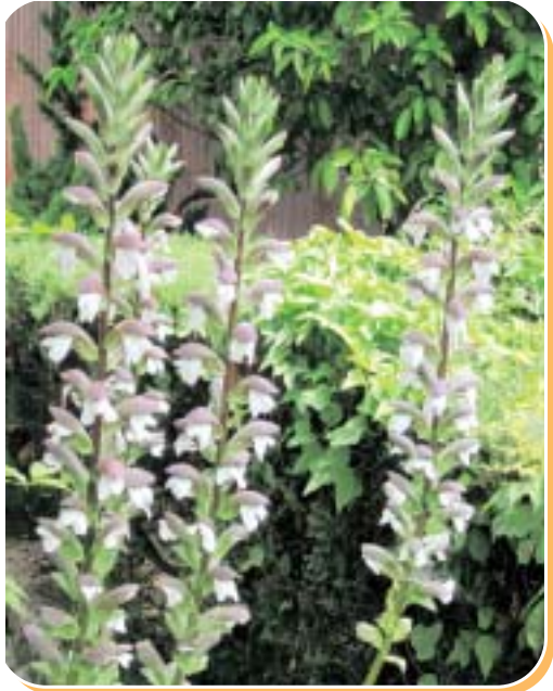
アカンサスがきれいに咲いています