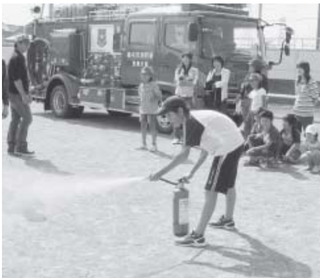
日ごろの訓練が大切ですね