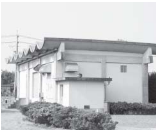
これがポンプ場です