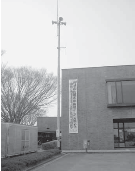
緊急時のお知らせ

防災行政無線は、有事や火災などを住民の皆さんにお知らせするための施設ですが、例外的利用として緊急性・公共性が高い事項などを放送しています。