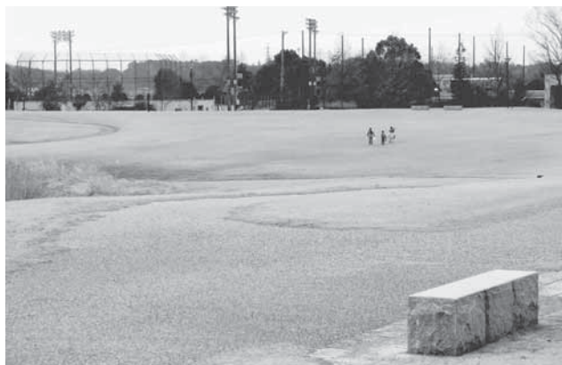
犬フンの後始末を

建設部長 中部公園施 設の被害は足元灯の照明 器具14基が壊されました。 警察へ被害届を提出し、 夜間パトロールの強化を お願いしました。また