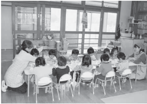
おねえちゃんと一緒に

リフォーム助成は町民が町内業者に住宅リフォームを発注した場合、改修費の5%～20%（限度額あり）を助成するものです。中古住宅の再生と業者の育成など、少ない財政負担でさまざまな業