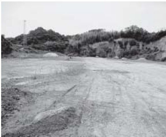
災害時の仮置き場に

と施策の関連性、②マニフェストを行程化した資料の全戸配布については質問しました。