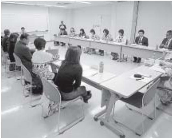
みんなの意見を出し合って

生ごみ対策検討委員会は平成23年12月5日に委員12名で第1回が開会され、今年4月17日には甲賀市水口庁舎で研修もされています。検討委員会で協議されている生ごみの処理方法はいつごろ町民に示されますか。