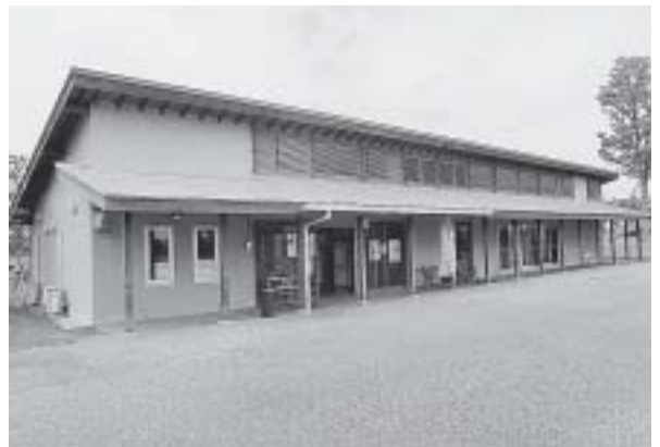
賑わいのまちの駅に