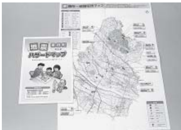
分かりやすいマップに

発達支援室を開設するにあたって考え方、支援体制を伺います。また、5歳児健康診査への取り組みが必要であると思いますが考えを伺います。生活福祉部長 保健、福祉、教育が一体となった「ワンストップ窓口」や乳幼児健診での発達チェックによる早期発見、個別支援計画の作成、保護者のサポート、情報提供やツールの引き継ぎが行える体制づくりを目指して人材育成の準備を行い、