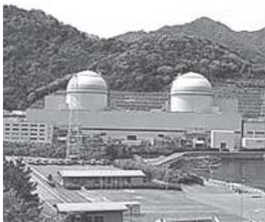
ストップ・ザ・原発

町長は所信でスマートシティ構想があることを表明されましたので、脱原発の思いは推測できませんが、あらためて原発への思いをお聞きします。 町長 平和利用とは言え、福島原発の事故で漏れ出した放射能の影響が周辺地域に広く拡散している現実があり、できるだけ早く終止符を打つべきと考えています。日本の技術をもってすれば可能と期待しています。