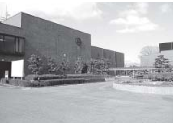
ここにも思いやりスペースを

③思いやりスペースは、身体障がい者の方や高齢者の方、妊娠している方、けがをされている方などを対象に、施設の入り口付近に屋根を設け6台ほどの予定です。 ④保健福祉センター周辺の改修は、まだ決まっていませんが、センターの老朽化が進み、来年度から新しい施策、仮称発達支援室などのこともあり、その時に考えます。