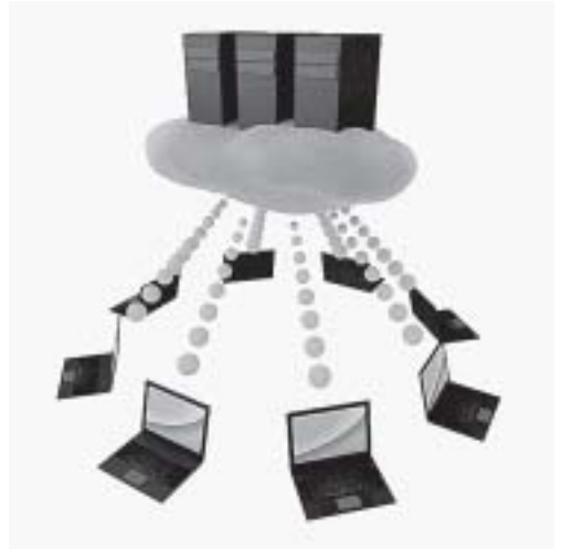
データの安全保管を

現在の電算システムは役場で火災が起きた場合に、今まで納付していた税金のデータなどがなくなる恐れがありますが、どのようにお考えかお伺いします。