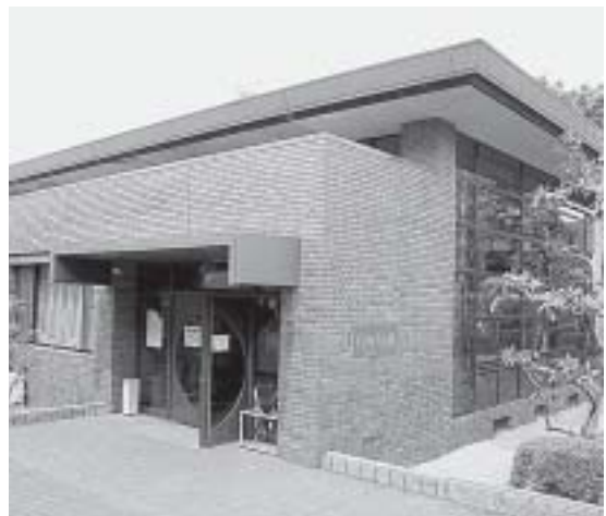
武道館の有効利用を

生活福祉部長 水質調査を年に4回、大気調査やダイオキシン類の調査も定期的に行っています。