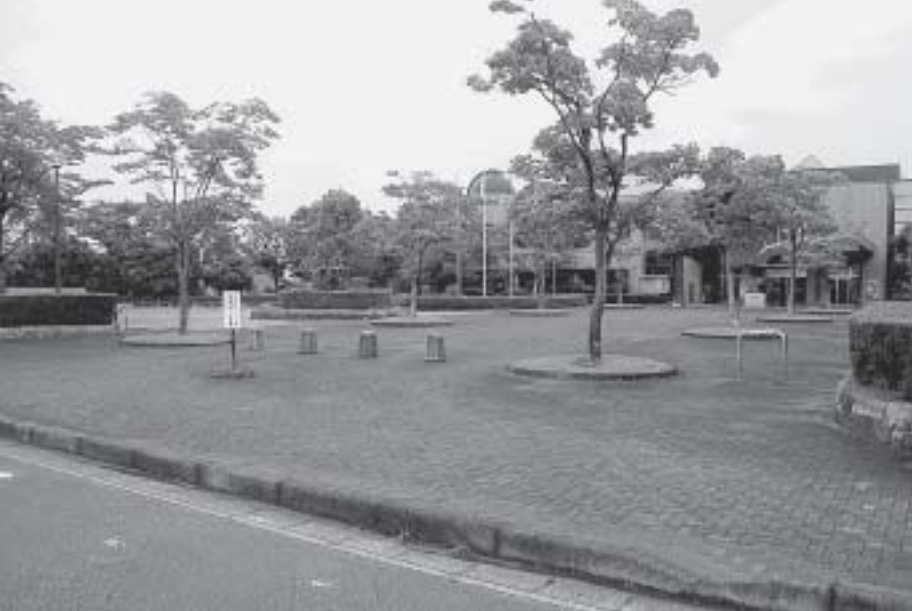
文化センター入口付近

問 団地は、はっきりとしていて、極力さけて、コスト的な問題もあり、今年度中でないと分からないのか、お示しください。 答 進め方は、今年度中に検討します。臨時職員の賃金と共済費は、県に補助率75%の補助金を申請します。