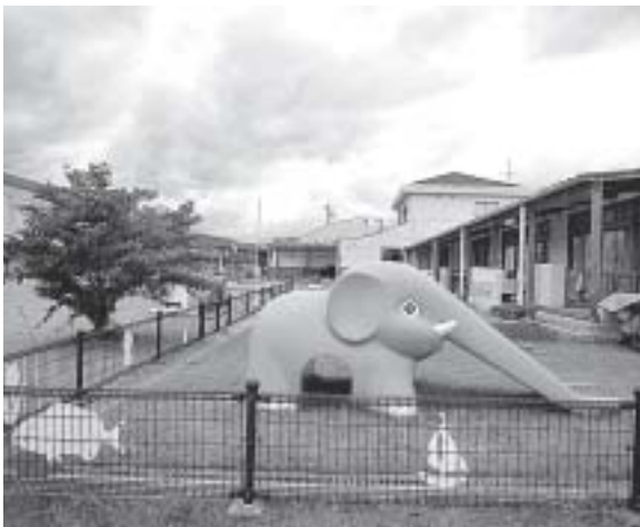
幼児教育の無償化を

2.9%です。政令が改正されたとしても、法定雇用率を上回る見込みでありませんが、少しでもこの率が向上するよう、障害者雇用についても、これまでに以上に取り組みます。