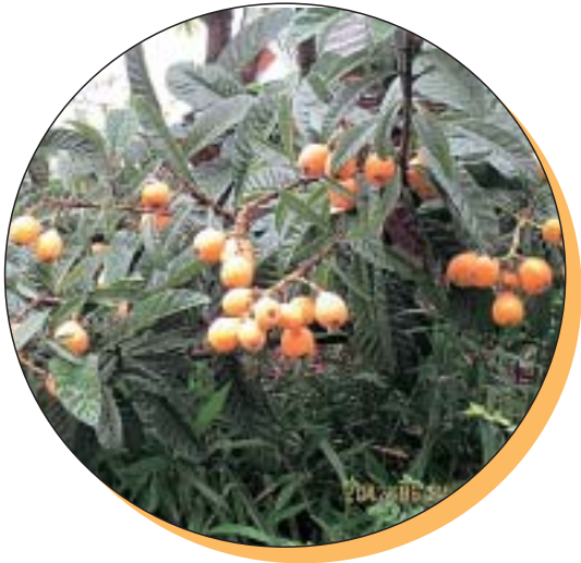
おいしそつな枇杷