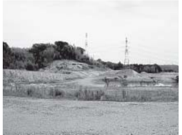
いつまで休止するの

企業団地（仮称）東員ハイブリッドパークが開発許可を受けてから5年を経過しようとしているが、東員町としての最終見解を述べてください。 町長 三重県よりの平成23年8月22日での変更個所について整理する必要があり、変更申請の提出について指導を行っているとの県の説明をいただき、現在は休止状態となっています。