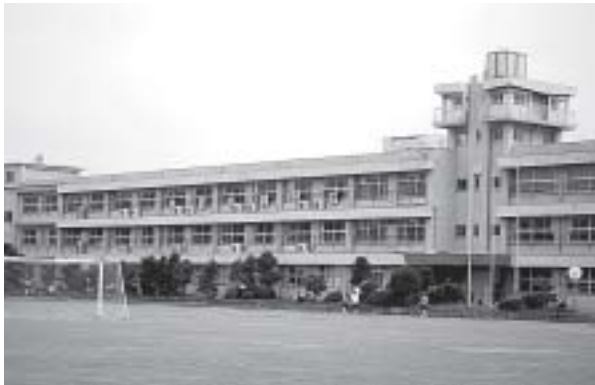
移転計画はあるの

東員第一中学校は、約50年前に建築されて、14年前に耐震化工事がなされました。また、設立当初は桑名市の久米村、七和村との学校組合立であったため、立地場所が東員町の東の端にあり、現在の東員町立になってからはかなり片寄った場所になってしまっています。今後、大胆な移転の計画はありますでしょうか。