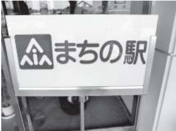
道の駅よりまちの駅

町の活性化には観光は不可欠です。観光に対する町の取り組みに対して4点質問させていただきます。 ①観光の要である文化協会と観光協会に対し町はどのようなサポートをされているのかお伺い致します。 ②現在行政として協会、施設などと定期的な会議は開催されていますか。 ③東海環状自動車道東員インターが平成27年度開通予定です。これに伴い何か具体的な取り組み