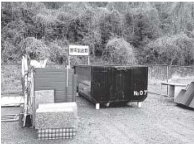
家電回収ボックス

町長 ①4月からゴミの減量化、資源の有効活用を目的として、粗大ゴミの搬入日に携帯電話など、レアメタルを含む小型家電類の回収を始めております。法施行後も引き続き現在の方法で実施していく予定です。 ②来年度考えておりますリサイクルセンターでの回収など、今後回収方法を検討していきます。 ③再資源化事業の実施に関する計画を作成し、主務大臣の認定を受け、法が施行されます来年度から認定事業者の認定受付が開始されます。回収した小型家電などを確実に適正なリサイクルを行う事業者を選定し進めていきたいと思えます。