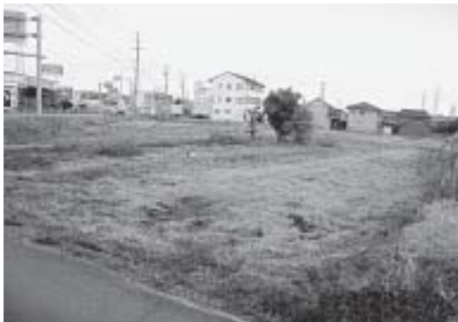
穴太ミニ団地予定地

収益的収入の消火栓修 繕費65万円の増額と収益 的支出の職員構成による 人件費の精査539万6 千円を減額するものです。