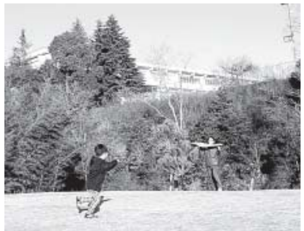
魅力ある東員町に

祝い金制度を廃止して、5歳児の保育料だけを無料にする提案ですが、3・4歳児も無料にすべきで