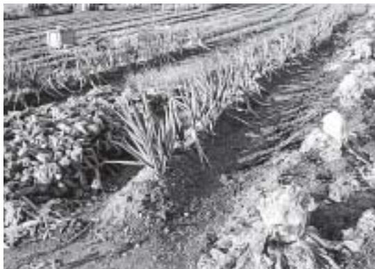
ブランド化に向けて