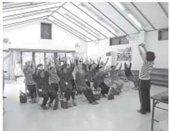
長寿番付表の復活を

生活福祉部長 さまざまなご意見をいただいておりますので、改善すべきところは改善し検討し続けていきます。