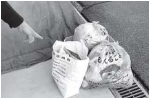
家にある袋の活用を

町長 可燃ごみの約40%を占める雑紙再資源化のために、町内企業から協賛（広告収入169万円）をもらい10月から実施を始めました。当初ごみ袋の予算の中で考えていましたが、不足する可