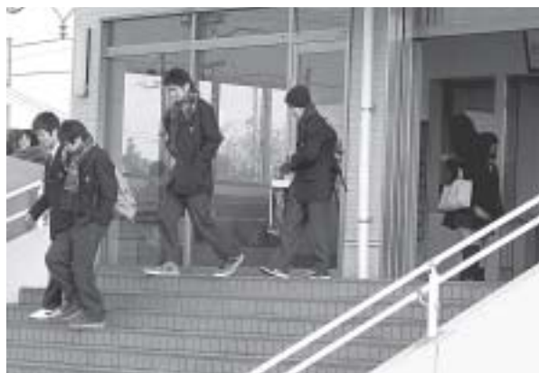
制度の有効活用を

平成16年以降実績はありませんが、今後、幅広い周知に努めると共に利用していただきやすい環境つ