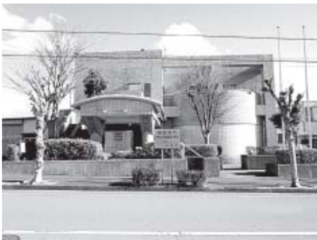
指定管理継続中止