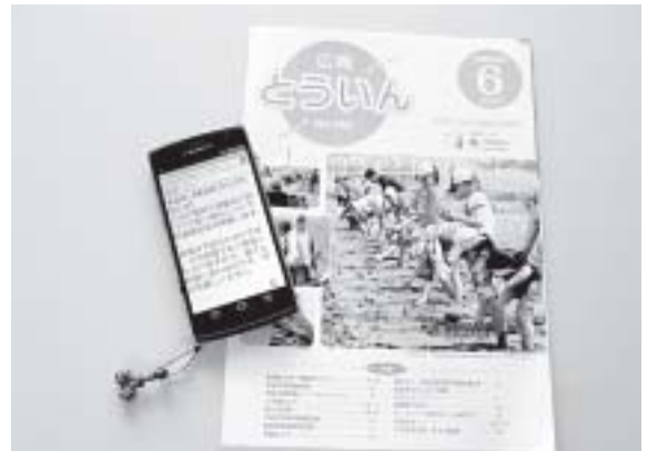
訃報メールの復活は

総務部長 訃報情報はメールに町のホームページへのリンク先を記載して送信していましたが、この方法ですと通信料がかかる場合があったり、