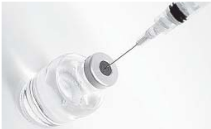
予防接種で安心を

※ ほかにジエネリック医薬品、障害者優先調達推進法、公園売店など3つの質問をしました。