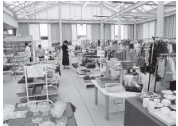
不要品から必需品に

桑名市リサイクル推進施設クルクル工房のような住民が身近に利用できるリサイクル施設の創設プランはありますか。 生活福祉部長 ごみの減量化に努め、可能な限りごみは資源としてリサイクルするなど資源循環型社会の構築を目指し、施設の建設に向けて調査を進めています。