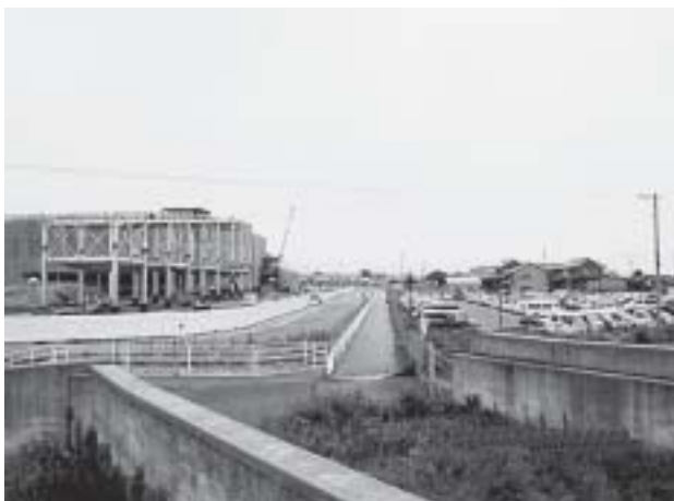
通学路に安全対策を

建設部長 6月中にもう一度開催をしたいと考えています。さらに召集の必要性があると判断したら、その都度開催を求めていきますし、召集がかかれば積極的に応じるつもりです。