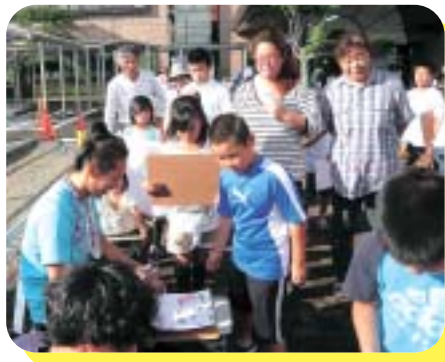
団長参上（ドデスカ！）