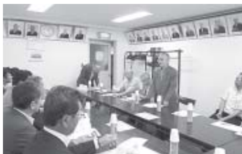
意見交換（川西市自治会役員）

策や親元近居助成制度など若者を増やすことに重点をおいており、また団地内の空き家、空き店舗などの活用を多岐にわたって検討しています。