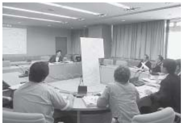
川西市役所で研修

えもあるようですが、気づいた時にこそ行動を起こすべきです。土台となる基礎調査の実施を求めます。また、町民参加のための情報提供や講演会などの計画を進めてください。