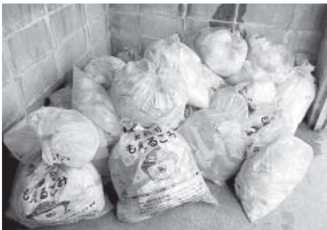
処理費用 約1億8,000万円

副町長 ごみにつきましては、町民の皆さまの協力なくしては減量や収集ができないと考えています。ごみの現状を知っていただくためにはよい方法と思いますが、堆肥化などの問題やいろいろなことが整った段階で、十分研究させていただきます。