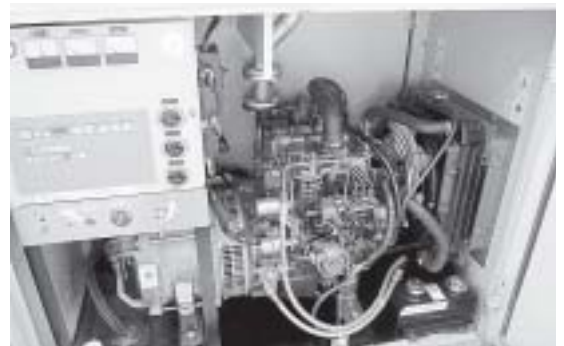
修理を終えた発電機

答 (学校教育課長) 現在は調理場が一つしかなく、一つの調理場で対応できる除去食での対応になります。