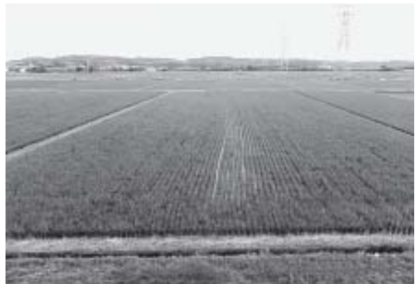
田んぼに使えるかな

③桑名広域清掃事業組合に支出している焼却負担金の約半分程度が削減でき、平成23年度の実績で試算すると年間約5千万円程度の負担金が削減される見込みです。堆肥化に要する経費については、生ゴミの回収方法や堆肥化の方法が決定していないため試算はできていませんが、費用対効果を念頭に効率的かつ経済的な方法を検討していきます。