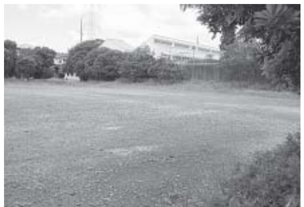
雨の日も利用しやすく