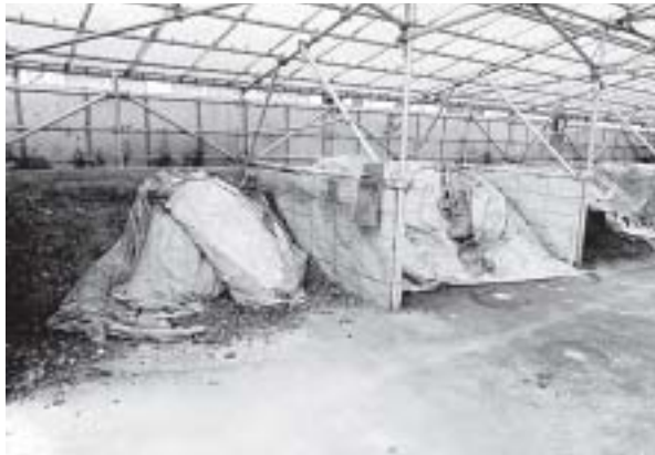
堆肥を作っています