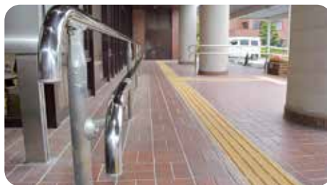
利用しやすくなりました(令和5年1月設置)