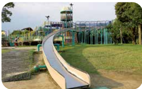
ローラーを修繕する滑り台

問 具体的にどのような費用を計上していますか。 答 ローラー滑り台の修繕と老朽化した健康遊具を取り替える費用などです。