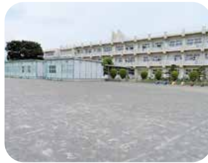
現仮設校舎の右側に予定