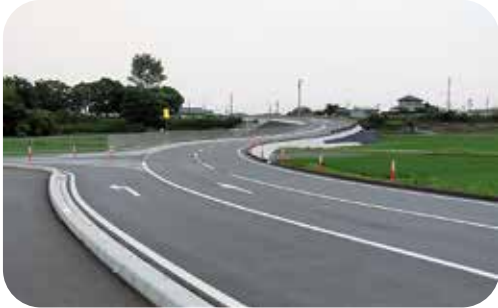
新しくできた県道