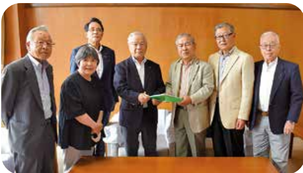
議会に「請願書」を提出する 健遊会のみなさん (5月9日)