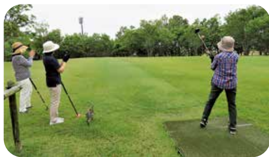
パークゴルフで楽しく健康増進を

問 オレンジバスの利用者が多いバス停には、雨や日差しをしのげる上屋（シェルター）を設置してはどうか。 答 政策課長 現在、役場や東員駅、ネオポリス内バス停の一部など合計13カ所に設置しています。乗降者が多い商業施設などは平成22年に設置検討をしましたが、地権者や事業主との調整がつきませんでした。 公共交通政策を進めてゆく中で再度検討します。