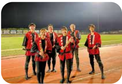
町内外から東員町の力になってくれる人たちが

町長 町外の人達が長く深くまちづくりに協働していただくため、空き家を活用した『民泊』サービスの検討もしており、健康活躍の「おみごと」があふれる東員町を目指します。