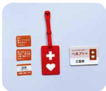
助けを求めやすく

なシールがあります。携帯電話や手帳など、身につけるものに貼って利用することができ、便利で伝えやすいと考えます。 ホームページにシールのデザインを掲載し、取得できる環境を整えることから始めようと考えています。 窓口での配布は、ニーズの把握を行い、検討していきます。