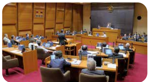
町三役の姿勢を質す一般質問

問 町長が掲げるさまざまな方針を副町長・教育長が、更に良いものにするために工夫を凝らしたり、軌道修正したり、時には「思い留まるよう進言」するのが、側近の務めであり責任だと思えます。 答 職員では、幹部職員で構成する町政運営会議が、町民目線をよく吟味をしてから議会に説明するのが本来の在り方だと思えますが、今は異論が出せない体質になっています。 特に「東員グッドニュース新聞」の発行代金1200万円には、多くの町民から異論が出ています。 東員第一中学校移転については、建設費高騰で町政に与える財政的な負担が大きくなり、行政サービス低下が懸念されています。 また、一部で用地買収の目途がついていないのに計画決定しています。ここは、地権者にご理解いただいで、「一旦立ち止まる」方が良いと思えますが、見切り発車