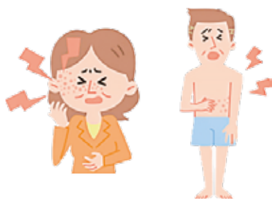
50歳を過ぎたら、带状疱疹の予防接種を受けることができます

問 带状疱疹ワクチンの公費助成制度について、令和3年12月定例会一般質問の答弁は、ワクチンの接種は国の動向を踏まえた上で検討したいとの答弁でした。今近隣市町でも公費助成が実施されていますが、その後どのように検討されてきたのか、またワクチンの公費助成はいつ頃に実施出来るのかを伺います。 答 健康長寿課長 発症の予防には、健康的な生活習慣、食事のバランス、適度な運動と十分な睡眠、ストレス疲れを溜めない。ワクチン接種も予防に有効です。令和3年12月定例会一般質問において、接種費用の助成制度についての質問がありました。前回の質問には、ワクチン接種を行うことにより病気に對して免疫力が高められ、発症や重症化を抑えられて、予防接種の意義は大きいのです。しかしながら、予防接種法に基づき国が接種を勧奨している定期接種とは異なる任意接種であることから、国の動向を踏まえた上で検討する、と答弁をしました。以降本町においても、ワクチンの公費助成の必要性について、近隣市町の実施状況も含めて検討を続けてきました。