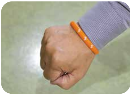
広めようオレンジリングの輪

今後は、フォローアップ研修などを実施し、地域で応援者を増やすために当事者に寄り添って進めていきます。