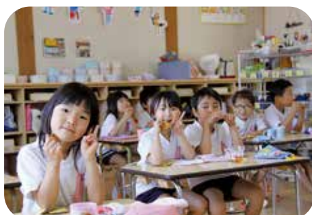
みんなで食べるとおいしいね！

町長 本町の子育て支援の優先順位は、子ども医療費支援の年齢延長や恒久的な給食費無償化ではなく、待機児童を無くすことが最優先と考えています。