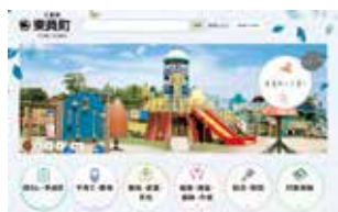
リニューアル予定のHP