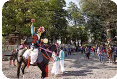
猪名部神社上げ馬神事

社会教育課長 「猪名部神社上げ馬神事」や「六把野獅子舞」などは「東員町文化芸術推進基本計画」に基づき今後他課とも連携してPR等に努めます。