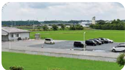
駐車場（砂利の部分）に建設予定