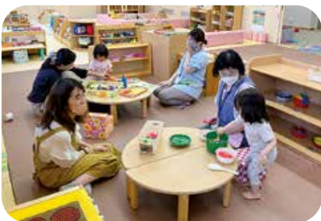
子育て支援センター

答 町長 非常に有効で、今すぐにも派遣したいと考えますが、現在、他省庁へ一名派遣していることも勘案し検討します。