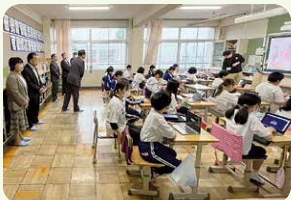
楽しい英語の授業を視察（5年生）

「GIGA スクール構想」に関する研修として町内の笹尾東小学校と東員第二中学校を視察調査しました。