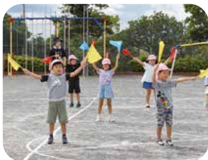
運動会の練習終わったら