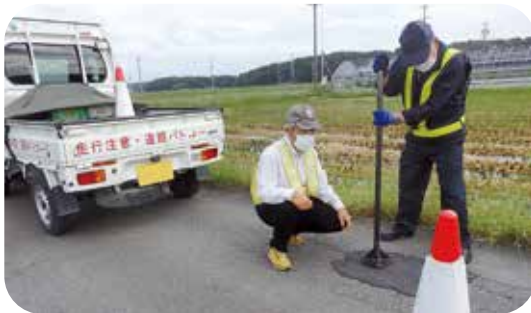
各地区を回ってます

答 健康長寿課 現在パークゴルフを半額で利用できる特典があります。今後、商工会などにお願いで、協力事業者を募っていきます。