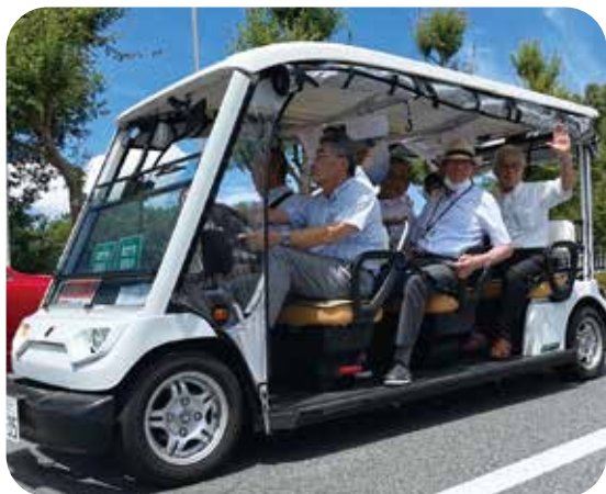
急坂の多い団地内を走っています

時速20キロ未満で公道を走ることのできる、ゴルフカートのような7人乗りの電動カートを使用し、自治会のボランティアさんで、お出かけ支援をしています。月・水・金・土の午前の2時間を定期的に無償運行しています。