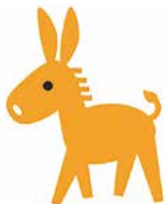
認知症サポーターのマスコット「ロバ隊長」

※チームオレンジ：厚労省の施策で地域のサポーターが初期段階からチームを組み、認知症の方とその家族の見守りと生活支援を行う取り組みです。