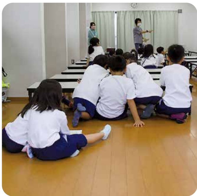
キッズ東員（学童保育）