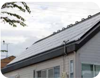
家庭用太陽光発電設備

問 申し込みが多数あった場合はどうなりますか。 答 みらい環境課 予算を超えた時は、次年度に受け付けます。