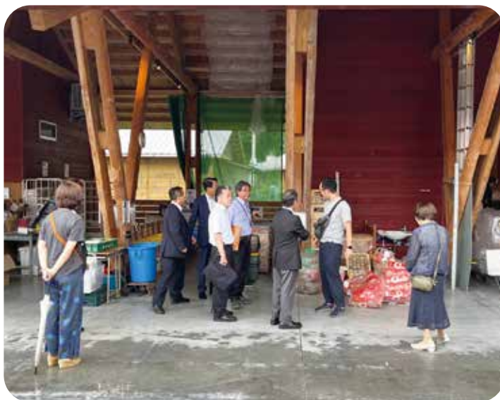
ゴミを45分別してリサイクル