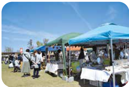
中部公園で開く TOIN マルシェ

※DMO：その地域にある自然、食、芸術・芸能、風習など観光資源に精通し、かつ、幅広い官民の連携によって観光地域づくりを推進する法人のこと。