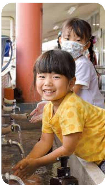
手をきれいに給食だ

答 保育園の手洗い場の改修状況はどうか。教育総務課 令和3年度にハンドル式のレバーへの取り替えを実施しました。