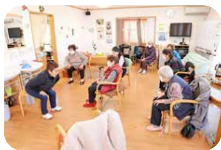
デイサービスにおける訓練風景

令和6年度からの第9期計画では、介護ニーズの高い85歳以上人口が令和17年頃まで増加が見込まれるため、労働力確保について、ICTの導入などに取り組みしていきます。