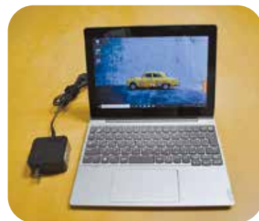
学習用子どものタブレット

青少年育成町民会議を中心に、町をはじめ、学校・家庭・地域との連携を図りながら注意喚起や啓発活動を行い、地域社会全体で取り組んでいきます。