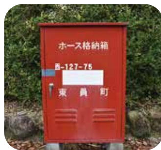
本当に撤去しても大丈夫ですか