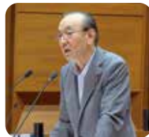
おたに 大谷 かつし 勝治

問 町道穴太弁天山2号線と県道四日市多度線の交差点から南側約430mの区間の道路幅が狭く事故が多く発生します。道路改修工事の進捗状況はどのようですか。