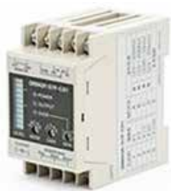
感震ブレーカーの製品例

総務課長 出火防止対策として全国で感震ブレーカー取り付け費用を補助する自治体もあり、国の動向、近隣市町の状況を把握し、検討します。