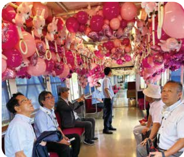
ピンクニュージンジャー号

鉄道部門は赤字のローカル鉄道ですが、観光収入にも力を入れ、本業以外の様々な施策を行い、全体では6年ぶりの黒字となっています。