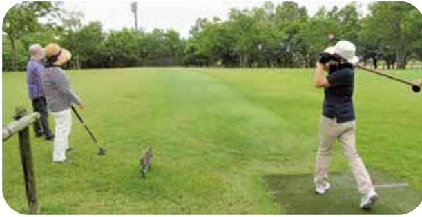
半額で楽しめます