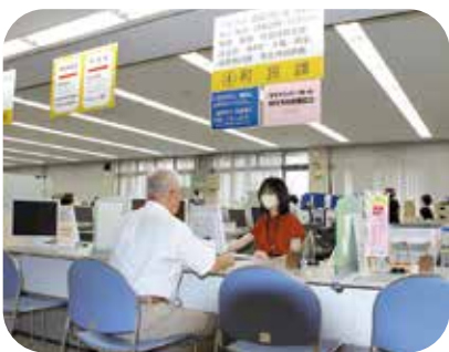
10月から開設する窓口

問 「端末を用いた申請」はどう行うのですか。 答 町民課 申請をする人が、タブレットの操作ボタンを押すと委託業者に繋がって対話しながら申請ができます。