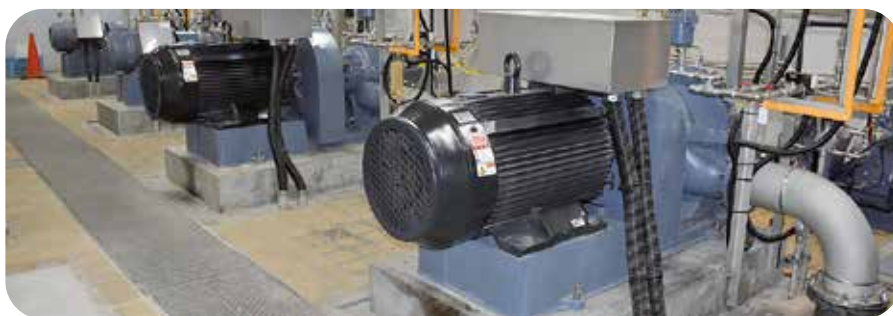
大きな配水ポンプ

答 上下水道課 エネルギー価格高騰と減価償却費が影響して純損失となりました。今回の電力高騰などで赤字になった部分は、留保資金などで補填していきます。