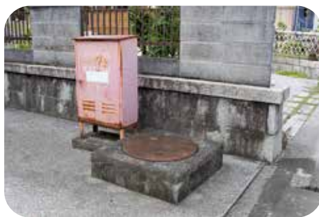
撤去する防火水槽