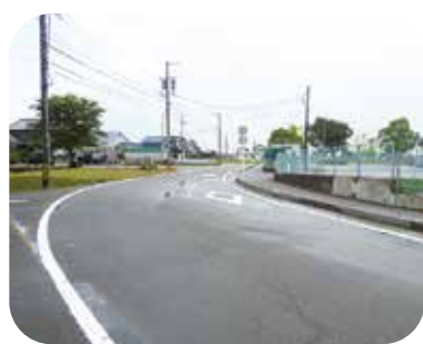
いなべ幼稚園入口前を横切る県道

限られた財源の中で、保育・幼児教育の質を高めるための施策を充実させ国の動向をみつつ、子育てに優しい環境づくりを進めていきます。