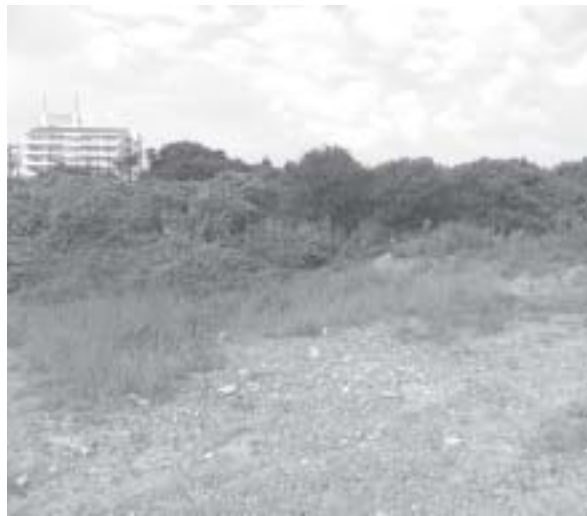
ここに工業団地が？

町長 人事異動は以前は3年でしたが、現在は5年ぐらいです。地方分権が始まり、深く対応できるためにはもう少し長い周期のほうが良いと考えています。専門職の採用は定員管理が厳しく、各分野に採用するのは難しいと考えています。研修を民間で行うことについては、できれば派遣をしたいと考えていま