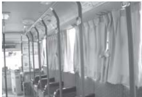
カーテンも付きました

11枚1000円の回数券のみでしたが、H18年1月より、1ヶ月2000円および3ヶ月5000円の定期券が発行されました。また、10月1日からは、障害者無料券制度が開始されました。