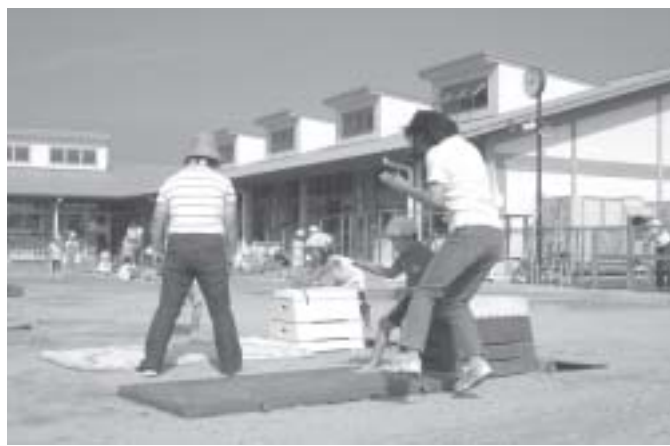
新築された、いなべ保幼の園舎