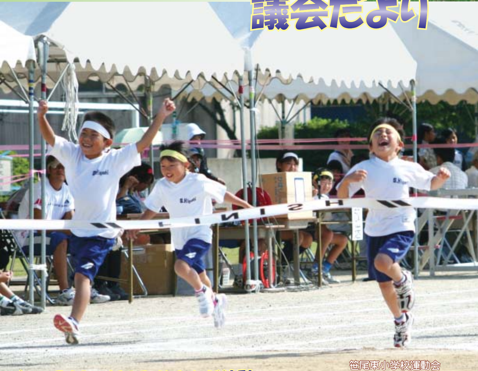
笹尾東小学校運動会