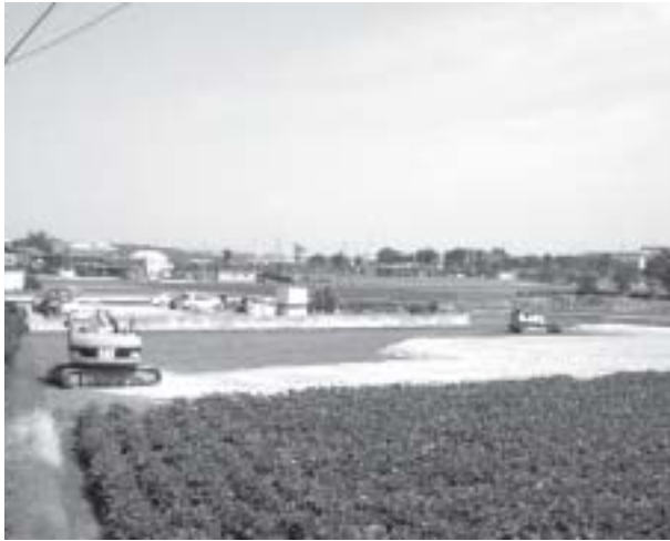
ここに障害者の新施設が