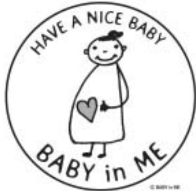
これがマタニティマークだ

「認定こども園」は幼稚園と保育所の機能を併せ持ち、子育て支援を行う総合施設「認定こども園」の認定基準の指針が告示されました。今後の方向性を伺います。 教育長 笹尾地区の施設整備が完了した時点で検討します。