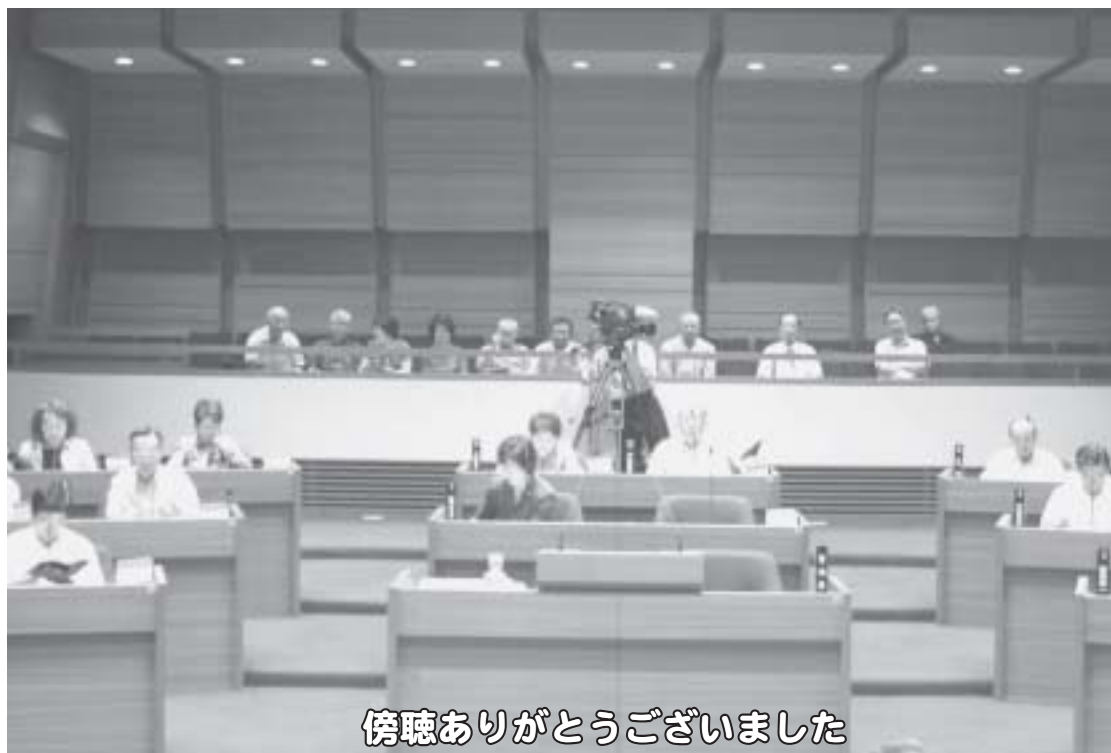
傍聴ありがとうございました

9月11・12日の両日、シニアカレッジのみなさんが、9月定例会一般質問の様様を4回に分けて傍聴されました。感想を寄せていただきましたので、その一部を掲載します。