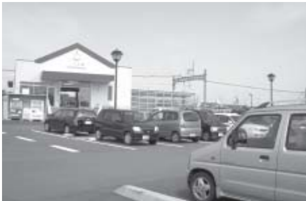
利用してください穴太駅