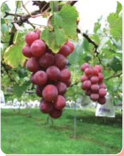
味覚の秋 (町内にて)