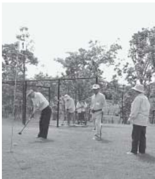
健康一番！パークゴルフ

町長 申請書については、様式の検討に入り、レイアウト・文字の大きさなど内部協議を行っており、統一の方向で来年早々には実施します。