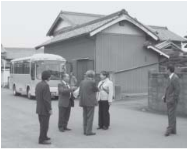
委員会による調査

オレンジバスは昨年度に比べ、乗客が増えていきます。もっと多くの町民の方々の足として利用されますよう、委員会も懸命に取り組んでいきます。