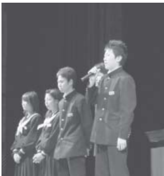
青少年の主張実行委員会のみなさん

※他に、某社の倉庫新築工事・町職員の人事評価・全国学力テスト不参加問題・パークゴルフ利用料の質問をしました。