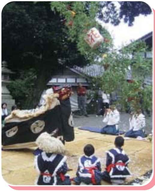
東員町無形民族文化財指定・・・六把野獅子舞