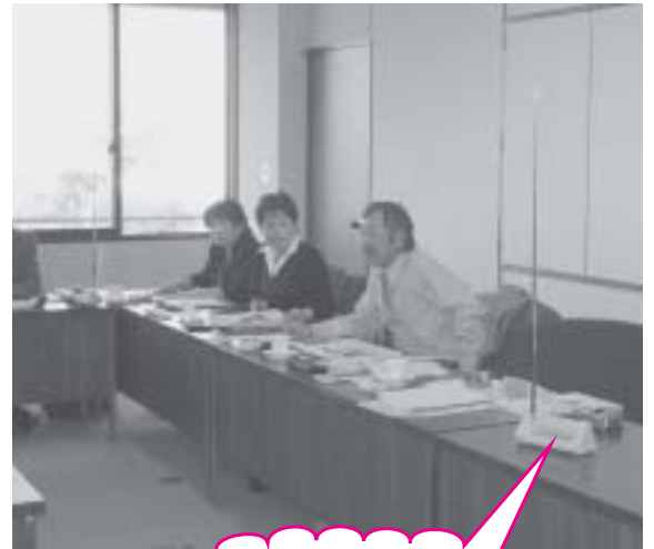
これが防災ラジオ