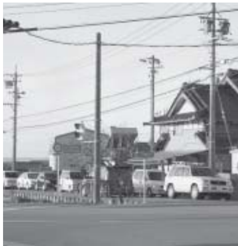
早急に交差点改良を