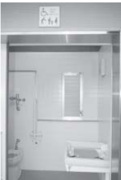
チャイルドキープのあるトイレ