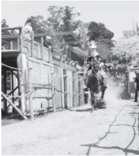
見に行こう大社祭