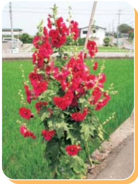
ど根性花……この花の名前は？