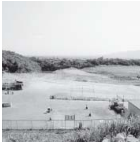
どうなるのか最終処分場

副町長 町としてもごみゼロプランを策定し、計画的に生ごみ処理機の普及を検討し、ごみの削減を推進していきます。