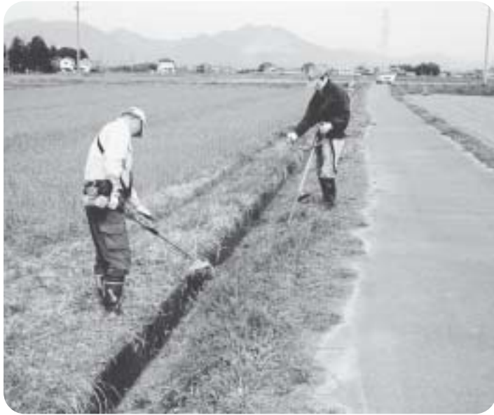
みんなで管理しています

農繁期に利用される方に、理解が得られるように啓蒙していきま。区分見直しについては今後調査します。