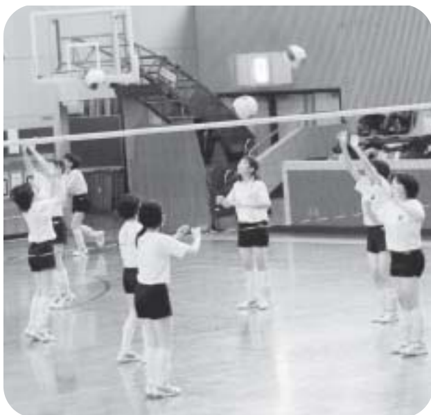
盛んなクラブ活動