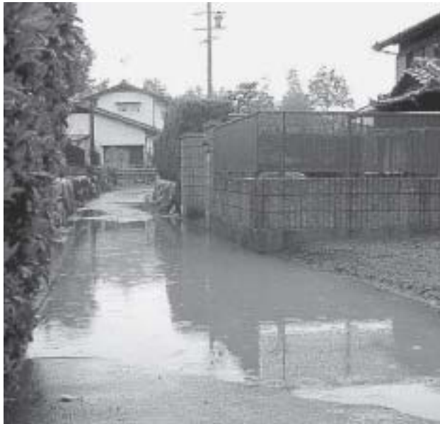
水はけの悪い道路