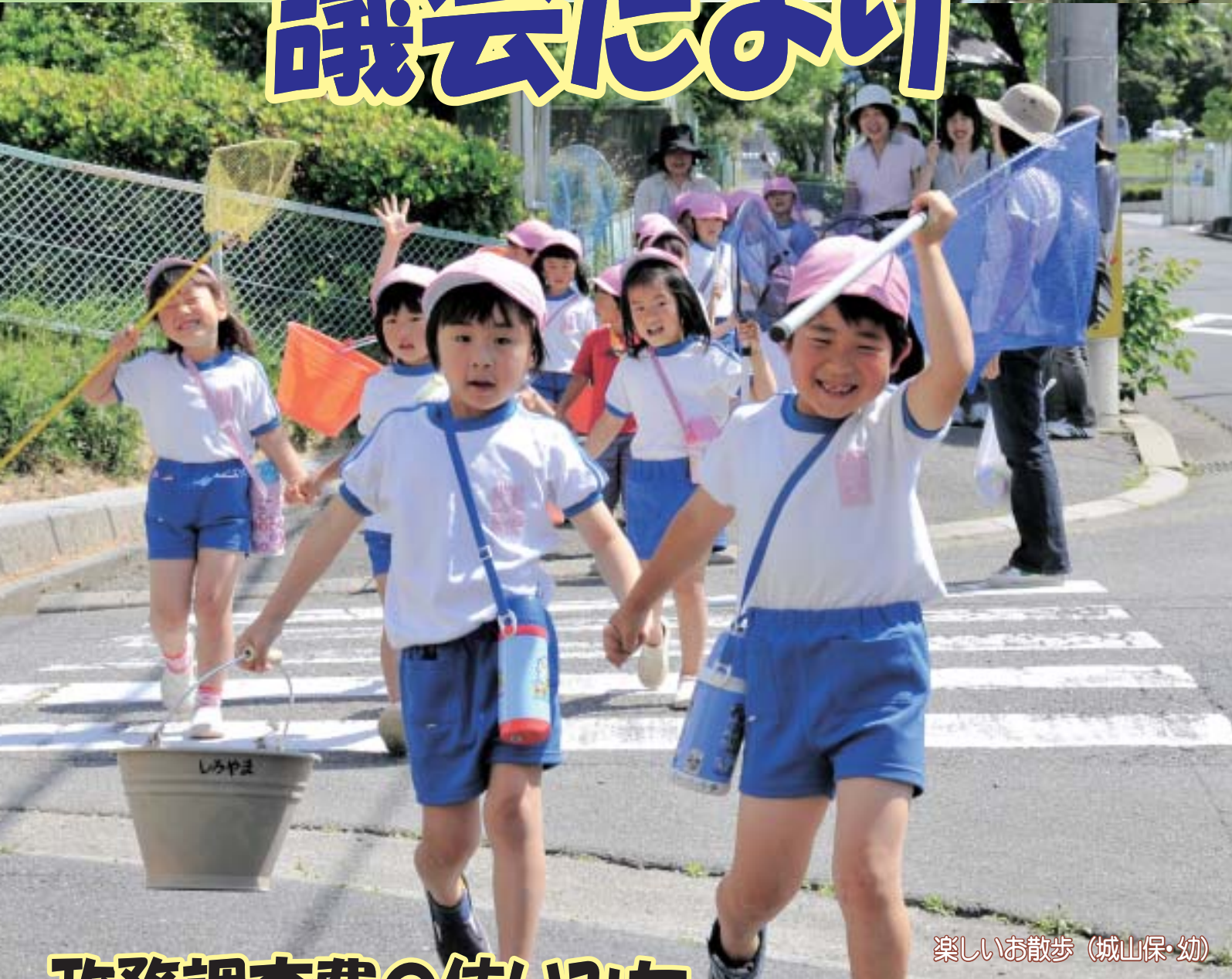
楽しいお散歩 (城山保・幼)