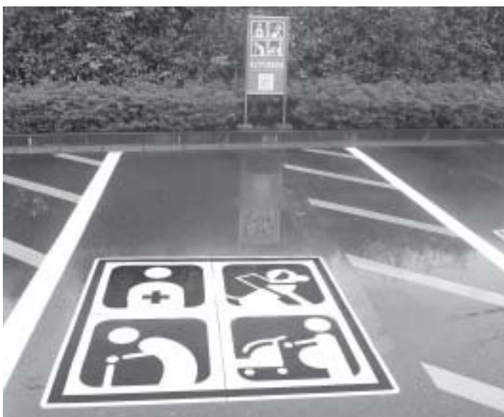
覚えてね、このマーク！