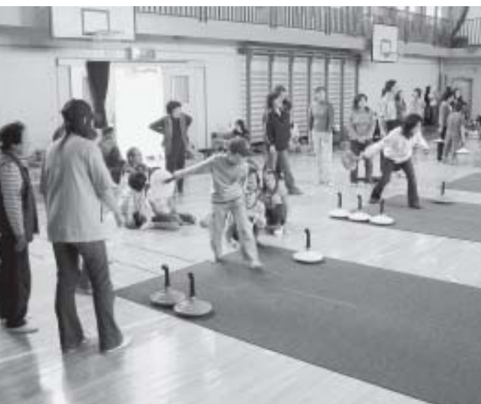
ユニカールで健康づくり

町長 「公務員でなければ対応できない分野」と「町民の皆さんと協働できる分野」を考慮し、総合型地域スポーツクラブの設立後に判断したいと考えています。