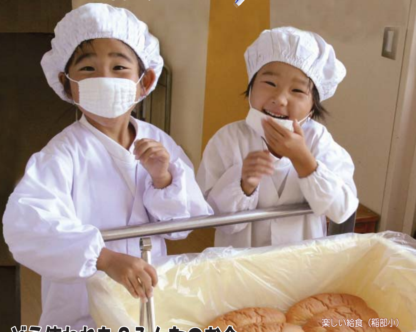
楽しい給食（稲部小）