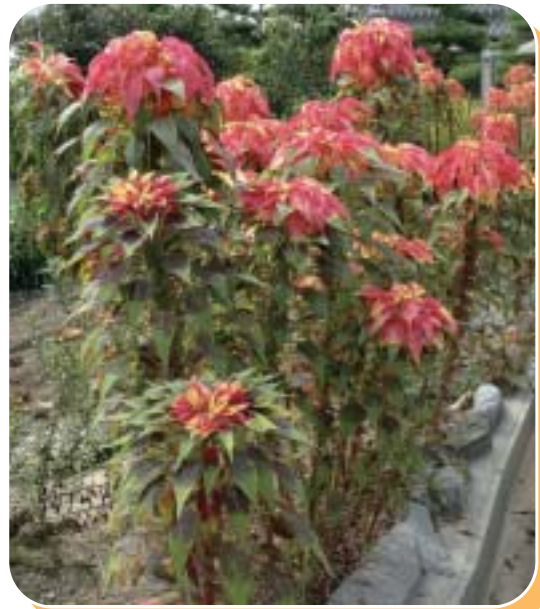
葉鶏頭（はけいとう）