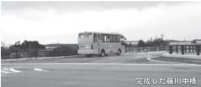
完成した藤川中橋