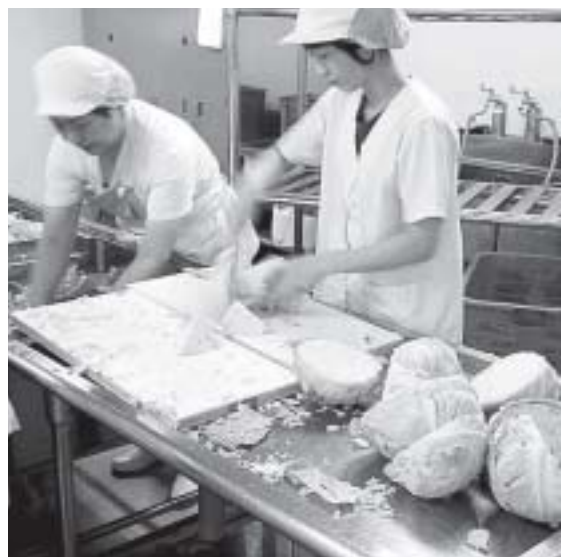
きょうの献立はなにかなあ