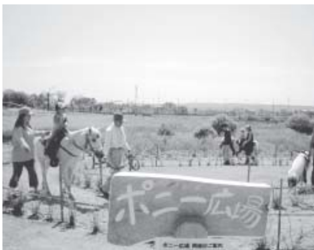
子どもたちにとっても人気です