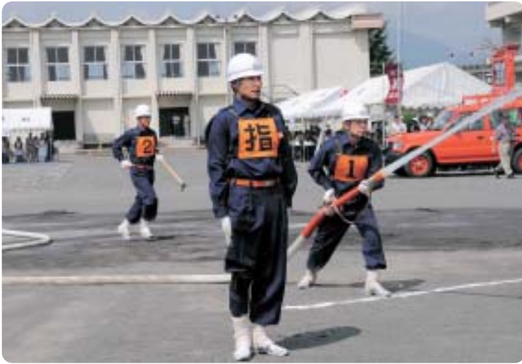
防災訓練で勇姿を披露しました