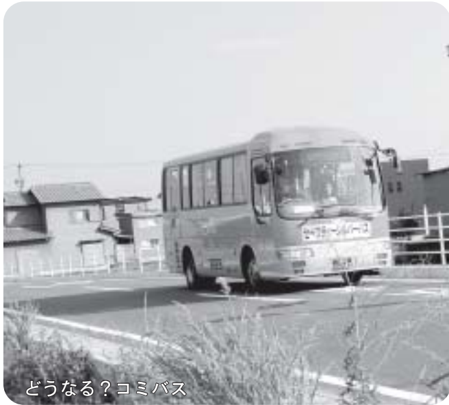
どうなる？コミバス