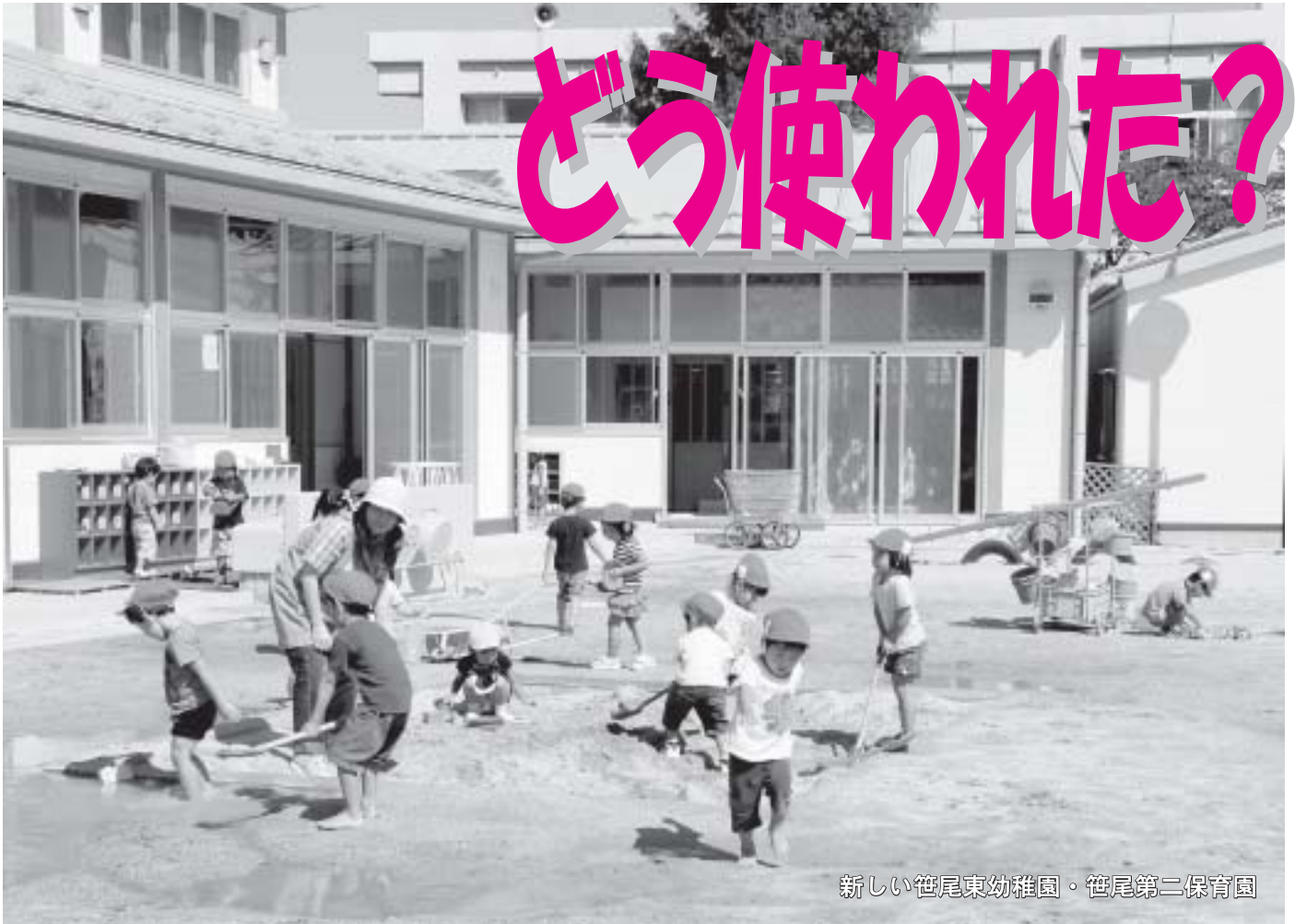
新しい笹尾東幼稚園・笹尾第二保育園