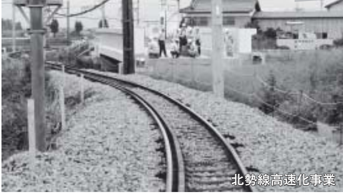
北勢線高速化事業