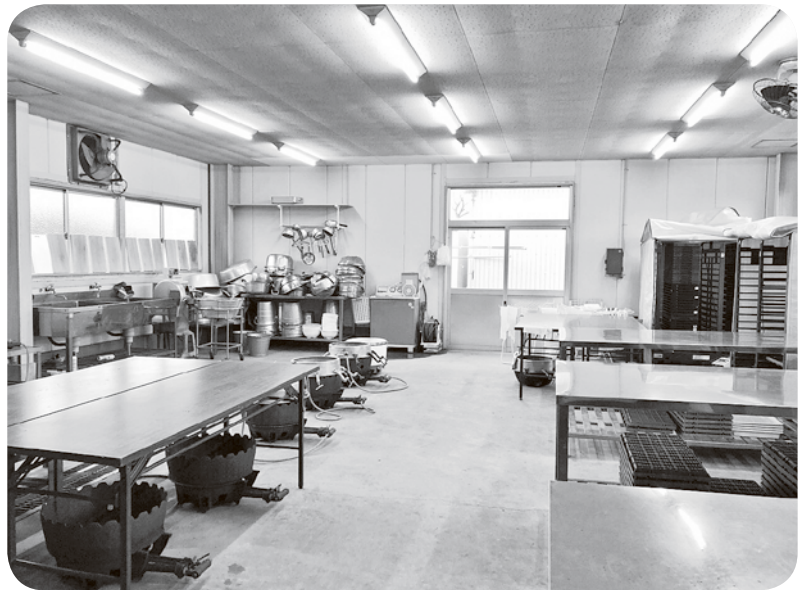
東員産大豆でおいしい手作りみそを

町長 新品種の大豆栽培、大豆パウダー化して加工、製品化して販売という大豆プロジェクトをまず確立させます。製品化させるところに女性やシニア世代など、町民主導のコミュニケーションが生まれてくれば、行政はバックアップしていきます。