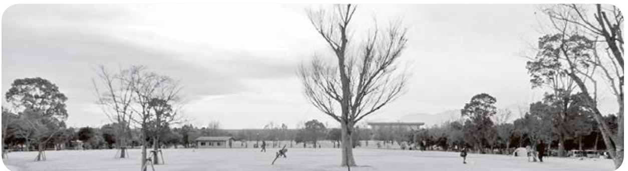
家族で楽しい時間を