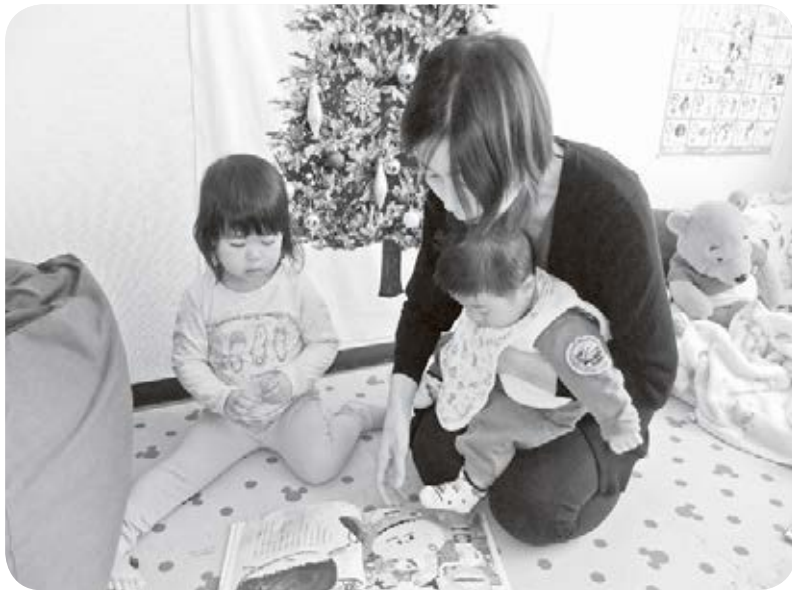
0～2歳の退園制度の見直しを