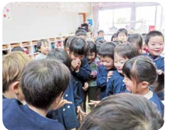
なかよくジャンケン・ポン