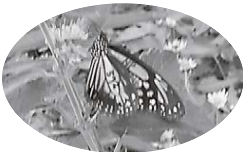
旅の途中に立ち寄ったアサギマダラ

※+10（ブラステン）とは 厚生労働省の身体活動・運 動施策で「ブラステン（今 より10分多く体を動かし ましょっ）」をキャッチフ レーズに、運動時間の目標 を「16〜64歳は1日60分、 65歳以上は1日40分」と 定めたもの。