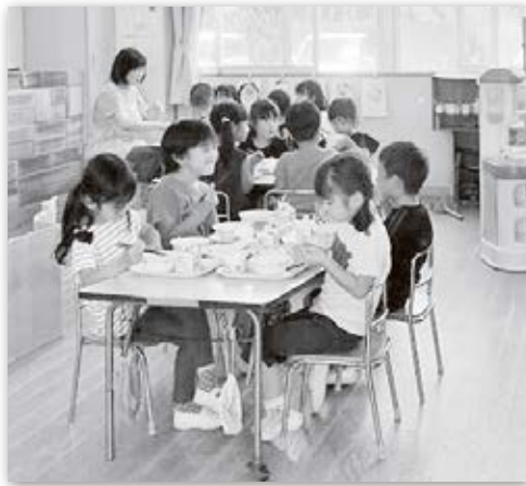
学校給食の米飯をキヌヒカリとし、100%東員産のお米で提供しています。 (平成30年4月から)