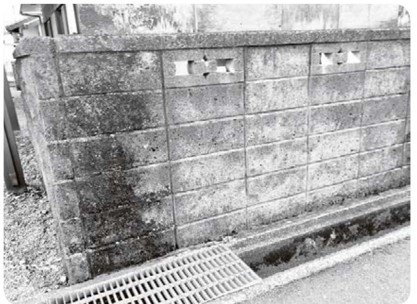
ブロック塀を安全に

通学路は教師・児童・生徒で登下校の危険箇所を点検し、家庭や自治会など情報共有を行い、自分自