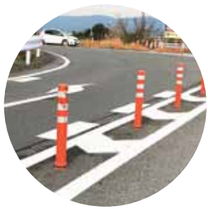
町内に設置してあるラバーポール

答 （建設課長補佐） 表示看板以外に、ラバーポールなどを設置し、視覚的に通りにくさを意識してもらえようような対策を計画しています。