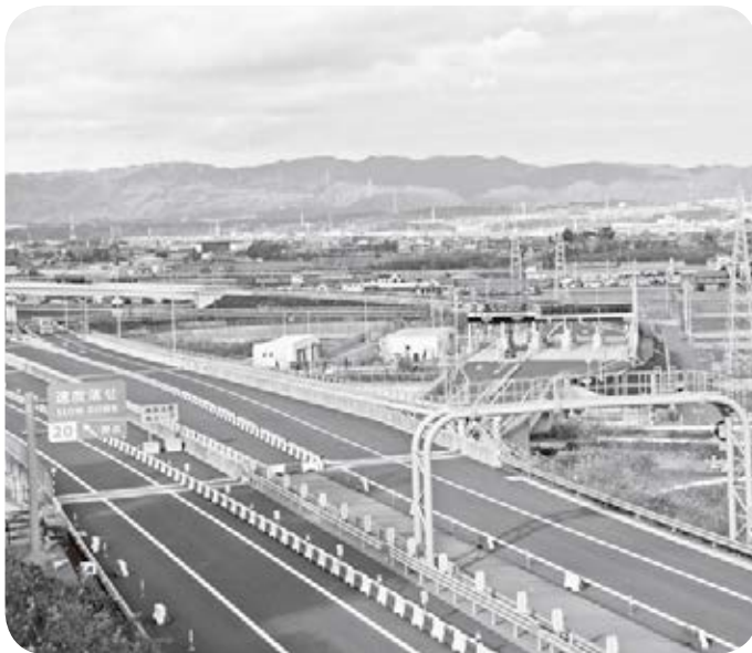
開発が望まれるインター周辺

平成26年から「喜び農業推進事業」としてブドウとブルーベリーの栽培に取り組み、現在では若手農業者に運営管理の引き継ぎをしています。