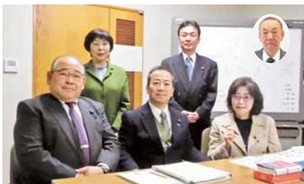
議会広報常任委員会

次回の定例会は 平成31年3月1日に 開会予定です。 傍聴、お待ちしております。