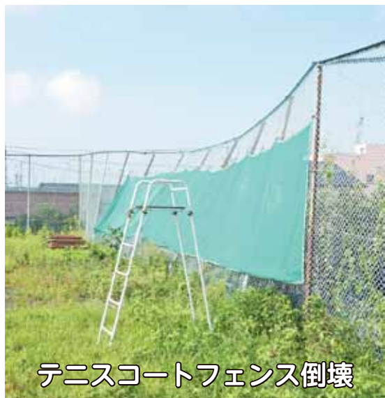
テニスコートフェンス倒壊