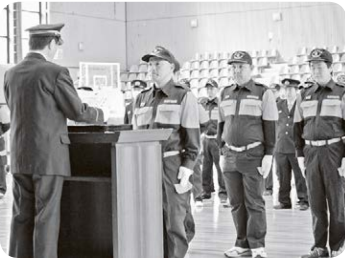
これからも安全・安心のために

答 町長 駅前開発断念直後から県と協議を進めており、年度内にも何らかの方向性が示されます。