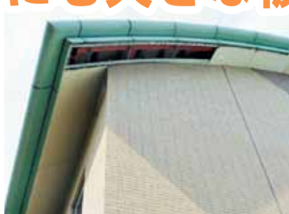
ふれあいセンター