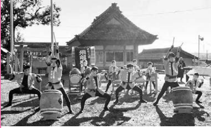
力強く初たたき（飛龍東員太鼓）