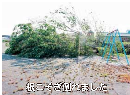
根こそぎ倒れました

台風の直撃は避けられましたが、町内の多くの施設の屋根やフェンス、高木が強風により被害に遭いました。