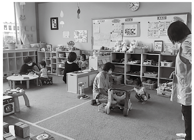
なかよし広場（子育て支援センター）