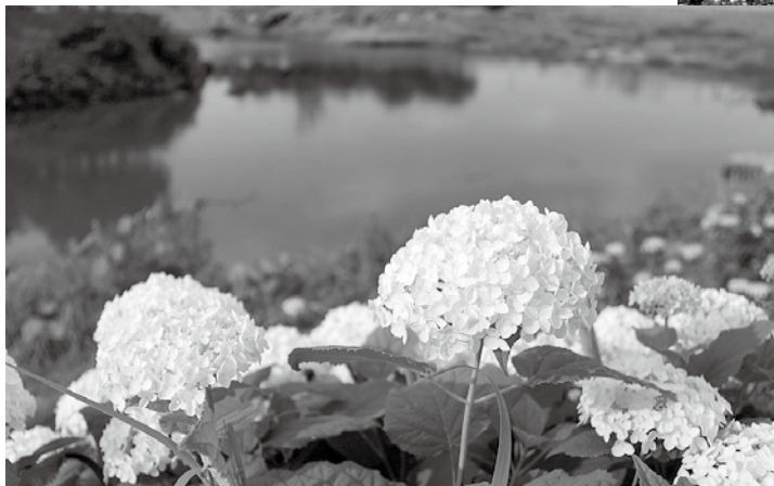
あじさい 中部公園の紫陽花