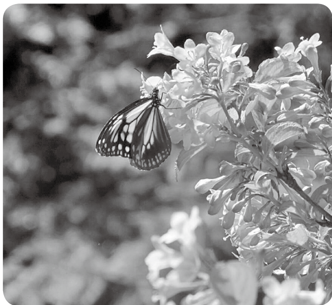
羽化が終わったアサギマダラが訪れました

新設中学のこと、新型コロナウィルスのことに興味があり読んでます。議会だよりが身近な存在になることを応援しています。