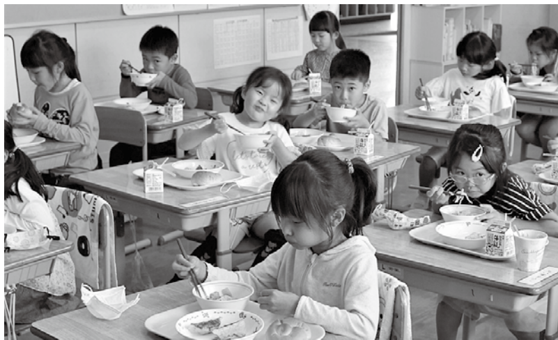
待ちに待った給食（三和小）

町内の保育園・幼稚園および小中学校の給食費を令和2年6月から12月まで無償化し、保護者の経済的負担を軽減します。