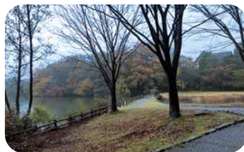
みんなで綺麗にしている山田溜公園

性と能力を十分に発揮し、格差をなくすための男女共同参画社会の実現に向けてお伺いします。① 意識啓発と進捗は。② コロナ禍、女性に対する暴力(DV)の増加や性犯罪対策の推進と相談体制は。