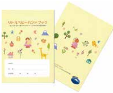
リトルベビーハンドブック

不安を抱えた母親に寄り添い不安を和らげることができそうです。県に、市町統一したハンドブックを働きかけます。