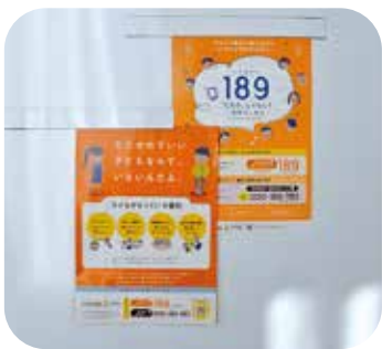
みんなで見守ろう子どもの育み

問 最近の児童虐待の発生件数とその取組や対応方法をお伺いします。そして、そこから見えてくる実態について伺います。 また、児童虐待に及ぼす影響として、DVが大きく関わっているケースがありますが、発生実態や関連について伺います。 虐待の重篤化を防止するには、町民全体で子育てを支え見守るという認識を持つて、町内全域に意識づけることが必要であるため、町宣言を積極的に実施することを求めます。