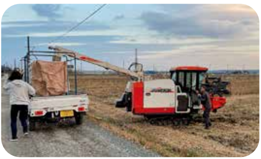
期待される大豆栽培

答 町長 以前は農業商工祭として実施していたが、ご提案の件は担当課で検討していきます。