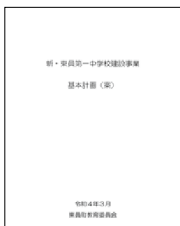
学び舎としての一の中に