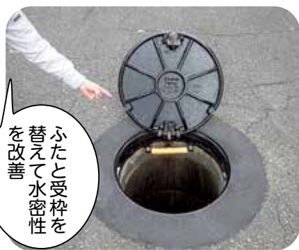
ふたと受枠を替えて水密性を改善

支援の方法は、新たな交付金「地域づくり交付金」の制度設計を進めており、自治会の皆さんと一緒に相談しながら進めていきたいと考えています。