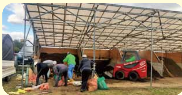
回収した生ごみから肥料を作る作業（堆肥舎）

当会は、希望される家庭の生ごみ たいひか を堆肥化し、資源としています。令和3年4月から給食センターの生ごみも堆肥化に加わりました。行政と協働・連携し、ごみ減量の啓発活動も行っています。