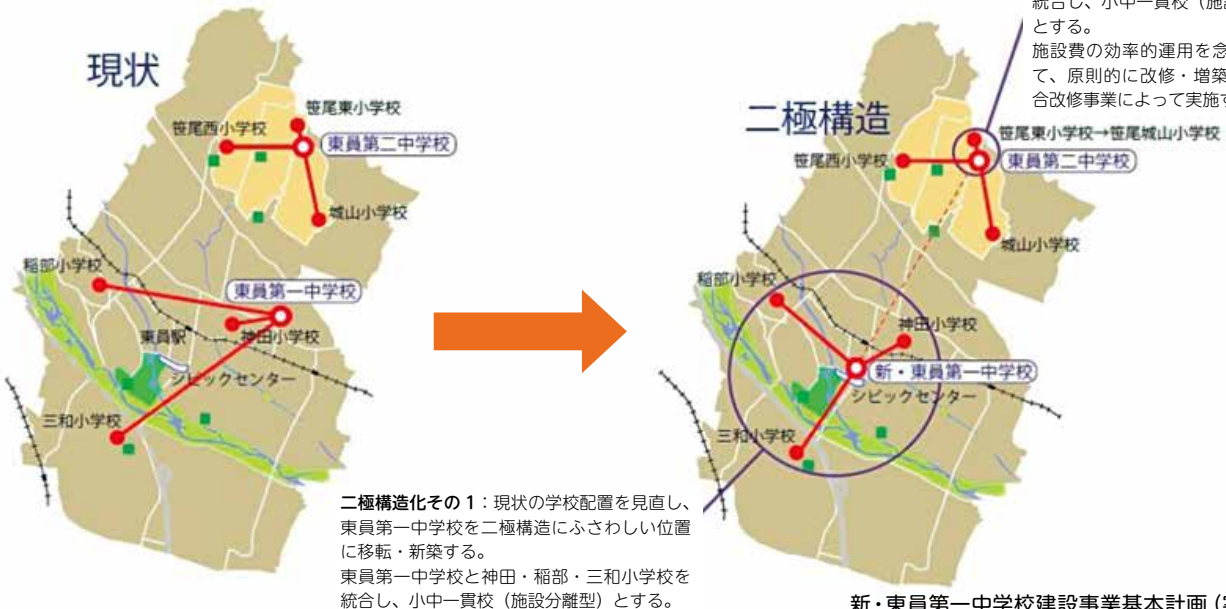
二極構造化その1：現状の学校配置を見直し、東員第一中学校を二極構造化にふさわしい位置に移転・新築する。 東員第一中学校と神田・稲部・三和小学校を統合し、小中一貫校（施設分離型）とする。

二極構造化その2：東員第二中学校および隣接する笹尾東小学校を統合し、小中一貫校（施設隣接型）とする。 施設費の効率的運用を念頭において、原則的に改修・増築による総合改修事業によって実施する。