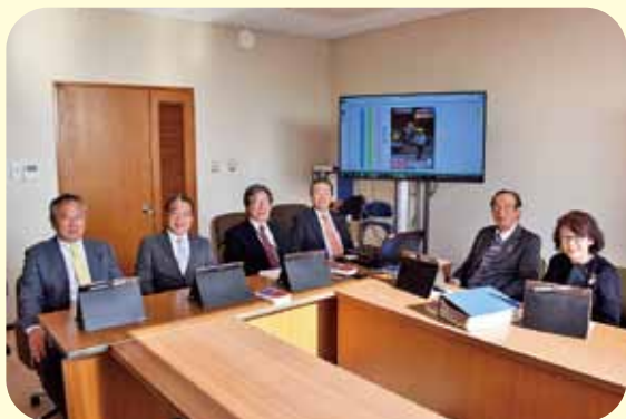
このメンバーで頑張りました