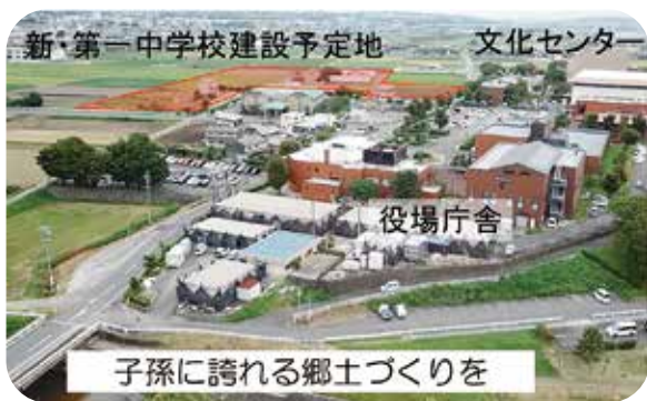
新・第一中学校建設予定地 文化センター 役場庁舎 子孫に誇れる郷土づくりを

答 町長 接種対象者の87%が2回目を終わっており、3回目の接種は全て個別接種になり、インターネットとコールセンターで順次受け付け予定です。