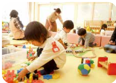
好評の子育て支援センター

胎児や新生児などにいろいろな不安を抱えるお母さんが、産婦人科医や小児科医とLINE（ライン）などを利用して、オンライン相談を行えるようにするものです。（じっくりと相談する場合は、ビデオ通話も可能です。）