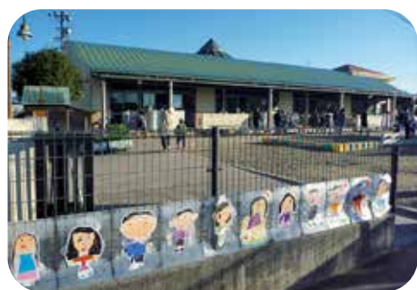
みんなで行けるといいね

しかし、年度途中の入園を申し込まれる方の対応が困難となっており、現在7名の待機が発生しています。育児退園については、保育士の確保・施設の問題から本町としては、見直す予定はありません。今後は保育室の拡充や民間活用の利用も検討し可能な限り受け入れを行っていきます。