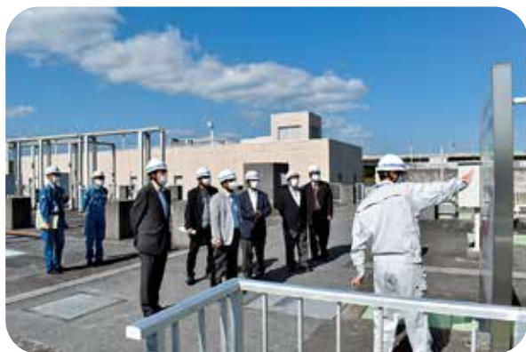
北部浄化センターで説明を聞く議員