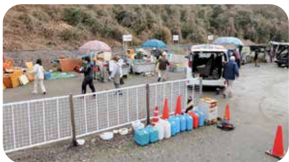
粗大ごみは搬入者が仕分けます

答 町長 熱意と実行力を持った若者たちで発足した「東員町観光振興会」と町が連携し、中部公園での各種イベント開催や町の魅力発信に取り組んでいます。