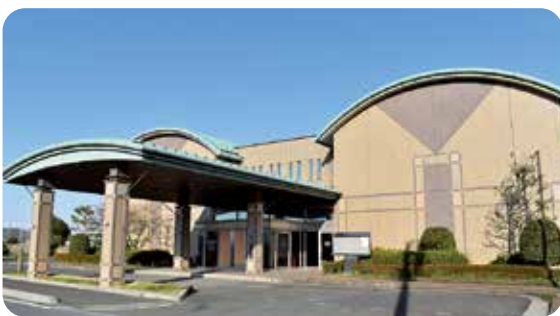
第一包括支援センターは令和4年4月からふれあいセンター1階に移動しました