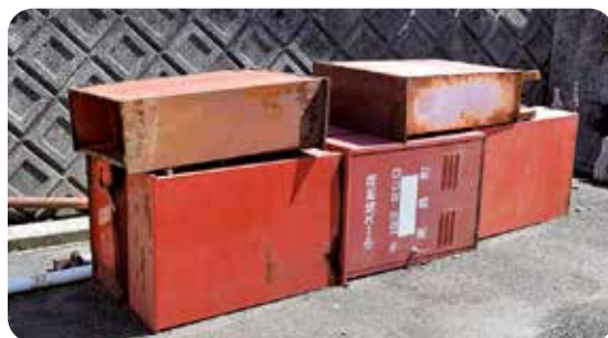
交換した消火栓ボックス