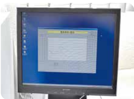
下水の流量監視モニター