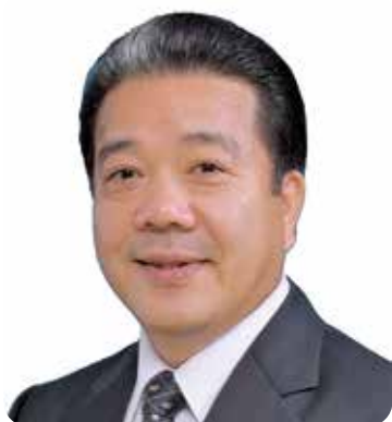
議長 三宅 耕三