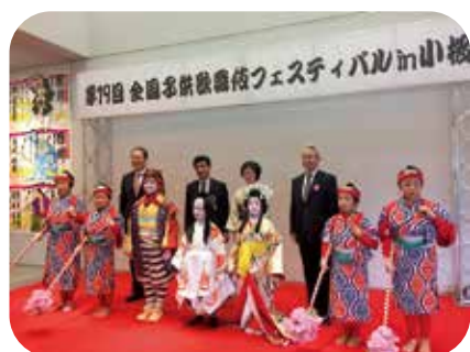
全国子ども歌舞伎フェスティバル

問 生活に安らぎと潤いをもたらし、子どもから大人まで、年齢・障がいの有無を問わず、すべての人の豊かな心と創造性を育む「文化芸術」についてお伺いします。 ①「仮称」東員町文化芸術基本条例」の内容はどのようですか。 ②長年継続してきている東員町三大文化事業「東員町こども歌舞伎」「東員ミュージカル」「東員日本の第九」はどうしていきますか。 答 教育長 ①文化芸術のみの振興にとどまらず、観光・福祉・教育・産業など本町のまちづくり政策に寄与する条例にしたいと考えています。 ②三大文化事業には毎年多くの方が来場され、「身近に演奏や演劇を鑑賞できた」「出演者が一生懸命演じられている姿に感動した」「舞台と観客が一体となった」など、高評を得ています。「町に愛着と誇り」を育む文化資本として大切にしていきます。