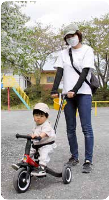
子育てしやすいまちに