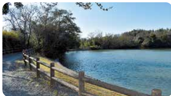
大雨でも大丈夫に

答 (産業課)全国でため池崩壊による甚大な被害が相次いだため、国が方針を決め実施するものです。町民の生命・財産などを守ることが目的であることから、堤体を補強する工事となります。令和6年度から県営事業として着手を目指しています。