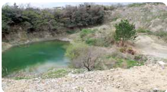
最終処分場の整備予定地