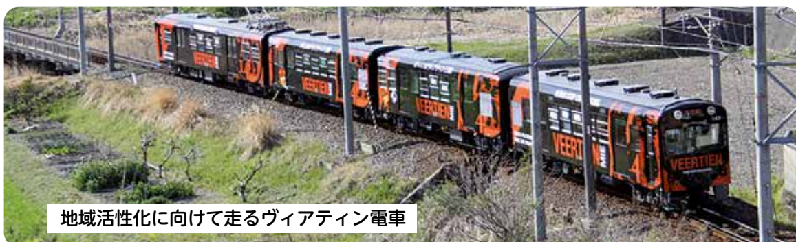
地域活性化に向けて走るヴィアティン電車