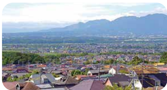
素晴らしい街並みを次世代へ

定住促進については、現在2つの補助制度があります。それぞれ町ホームページなどでご案内しています。