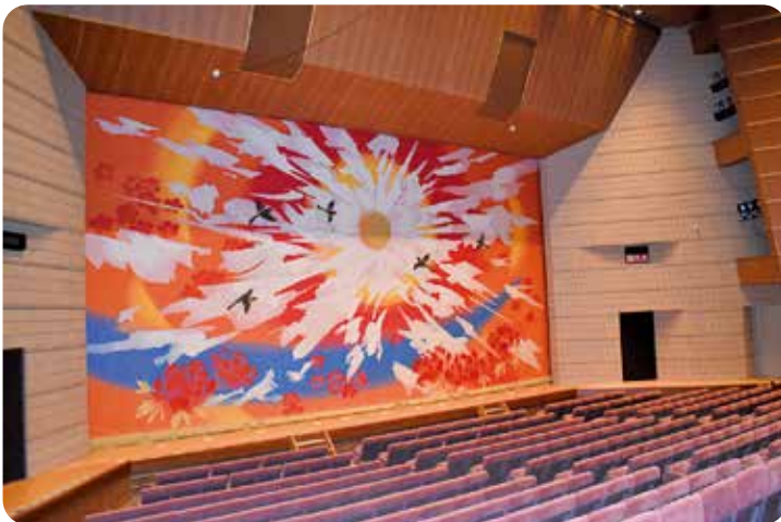
ひばりホールの舞台