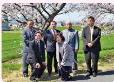
新メンバーで2年間がんばります