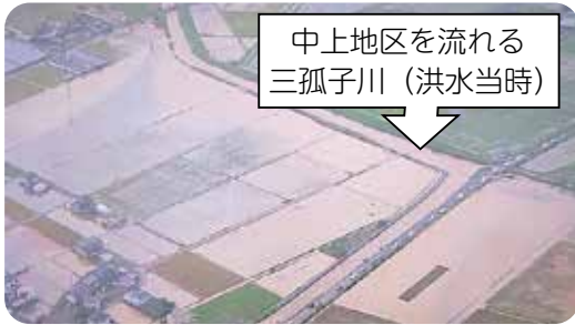
中上地区を流れる三孤子川 (洪水当時)

被害の起因となった三孤子川は、河川拡幅工事の迅速化を三重県に強く要望していきます。