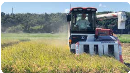
みんなで食べよう東員町のお米