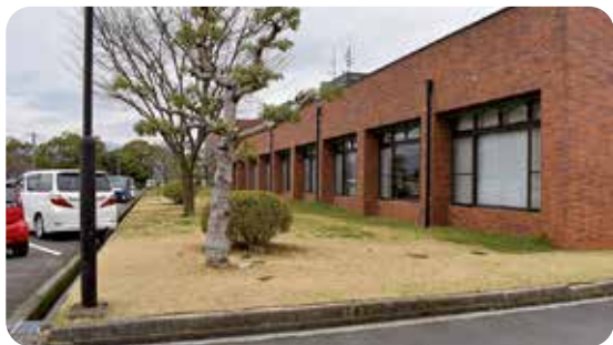
駐車場の増設予定地

東員町農業振興部会(担い手農業者で結成)を通じて、農協で精米し配達する予定で検討中です。