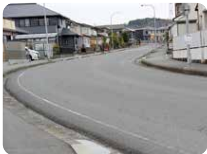
白線が消えた道路

脱炭素社会の実現を 問 みらい環境課の一番の新規事業は何ですか。 答（環境防災課）脱炭素社会に向けた計画策定が新しい取り組みです。