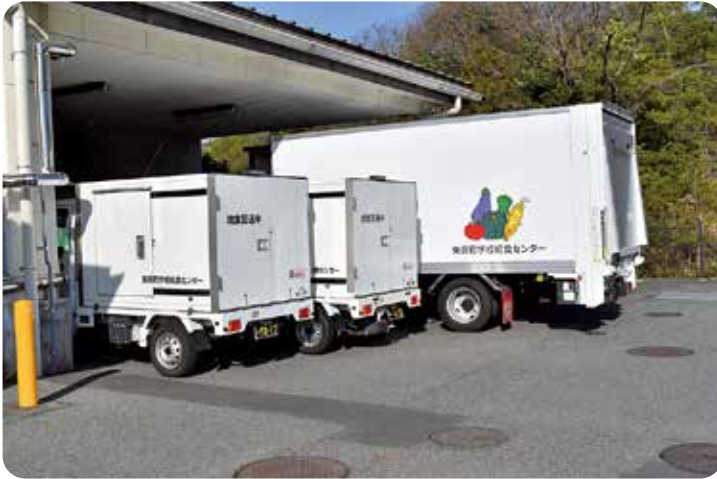
給食センターから幼稚園・小学校・中学校に配送しています

第6次東員町総合計画に沿った各種事業に掲げる経費などで、これからの東員町に向けた大切な予算です。情報紙発行の案件に関する議論もありましたが、総じて町にとって必要かつ重要であり賛成します。